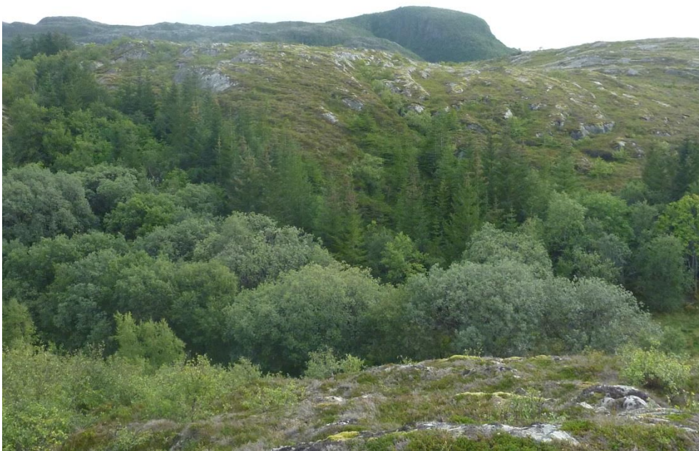
Figur 4: Spredningen fra sitkagranfeltet lenger øst anbefales fjernet.