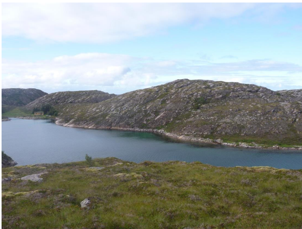
Figur 1: Tørr kystlynghei finnes i de skrinne partiene mens fuktig lynghei danner et sammenhengende feltsjikt i laverliggende terreng.