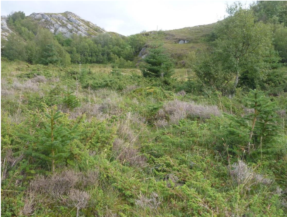
Figur 3: I et lite parti på østsida av lokaliteten finnes det en del smågran som anbefales å rives opp som hele individer før de blir for stor og setter frø.