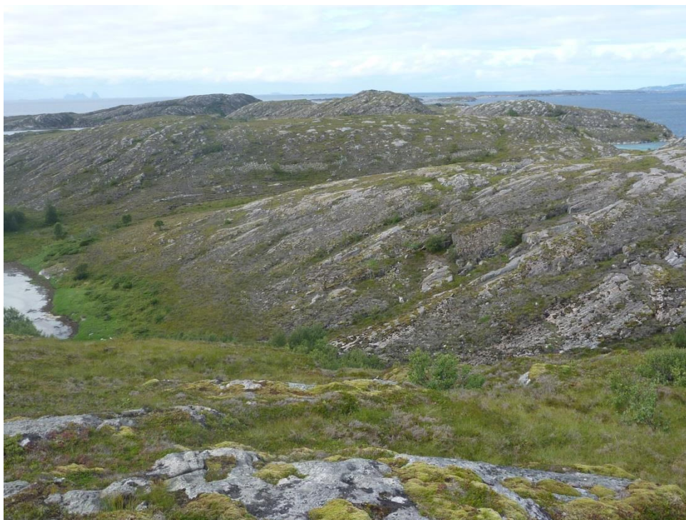
Figur 2: Sviing er mest aktuell i de skrinne partiene hvor røsslyngen har fått noen tørkeskader fra vinteren 2013/14. Sviing kan være utfordrende siden det er skrint og vegetasjonsdekket ikke henger sammen. Nederst i skråningen ser det ut til at det er lettest å få til sviing (Foto: A. Bär).