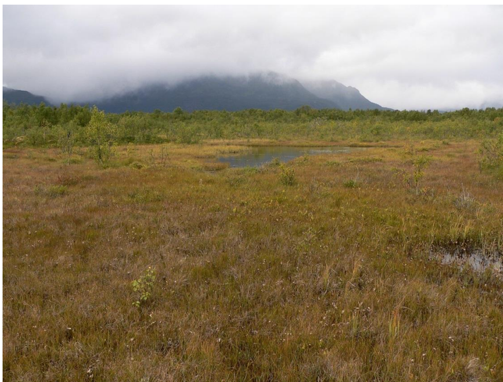
Figur 2. Fattig fukthei forekommer i mosaikk med grasrike intermediære rikmyrsflater.