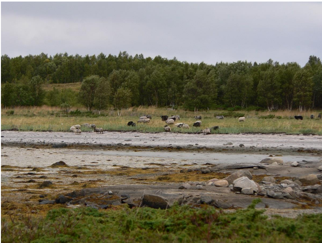
Figur 4. Det er ca. 45 søyer med lam av rasen GNS på beite.