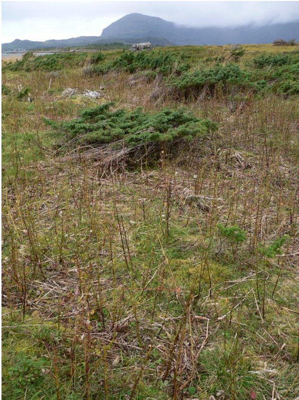
Figur 5. Gjengroingsarter som mjødurter har blitt godt nedbeitet av sauene (Foto: T.H. Carlsen).