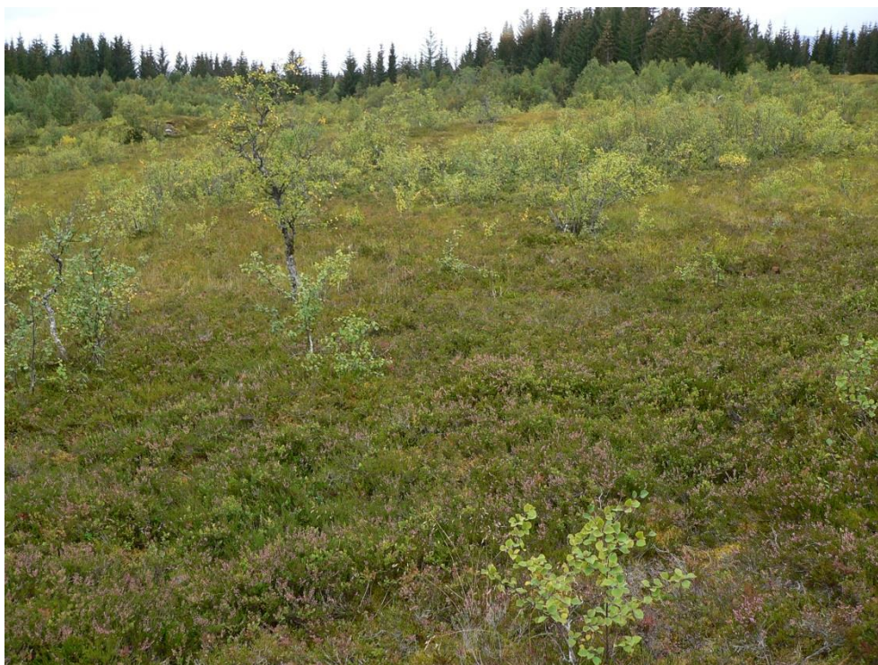
Figur 1. Fattig fukthei domineres av røsslyng sammen med krekling, torvmyrull, blokkebær og molte. Det finnes en del bjørkekratt som bør fjernes etter hvert.