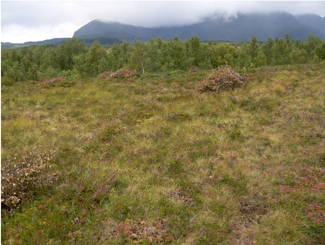
Figur 3. Beitebrukeren har begynt å rydde krattoppslag.