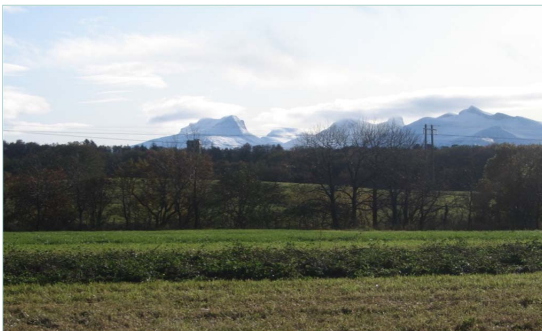
Feltet på Vågønes i Nordland er snart klart for hausting av raudkløverfrø.

I 2007 sådde me ut ei blanding av timotei, engsvingel og raudkløver på fem stader. Blandinga besto av 65 % timotei, 25% engsvingel og 10% raudkløver. Felta var om lag 600 m 2 , med nokre lokale tilpassingar. Felta vart lagt til einingar i Bioforsk, så nær som i Østfold der det var Norsk Landbruksrådgiving Sør Øst som tok på seg feltarbeidet. I 2008 vart det etablert to felt til, eit på Snåsa i regi av Norsk Landbruksrådgiving Nord-Trøndelag og eit på Alstahaug i regi av Norsk Landbruksrådgiving Helgeland. Som tabell 1 viser vart det totalt sju felt med ei rimeleg bra fordeling geografisk.