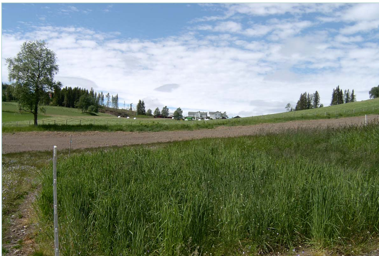
Frøfelt av timotei «Flaten 2010», fotografert 1.juli 2015 av Kristin Daugstad.

I 2013 vart det planta 200 individ av kvar av engsvingel populasjonane «Alstahaug2012» og «Vågønes2010» på Løken. Dette var for å få nok frø til at dei kan vere med i nye seleksjonsrunder. Frøavlinga i 2014 vart bra og det er no 2,8 kg rensa frø av «Alstahaug2012» og 3,2 kg av «Vågønes2010». I 2014 vart det planta 200 planter av timoteien «Flaten 2010» som det vart hausta vel 3,3 kg frø av i 2015.