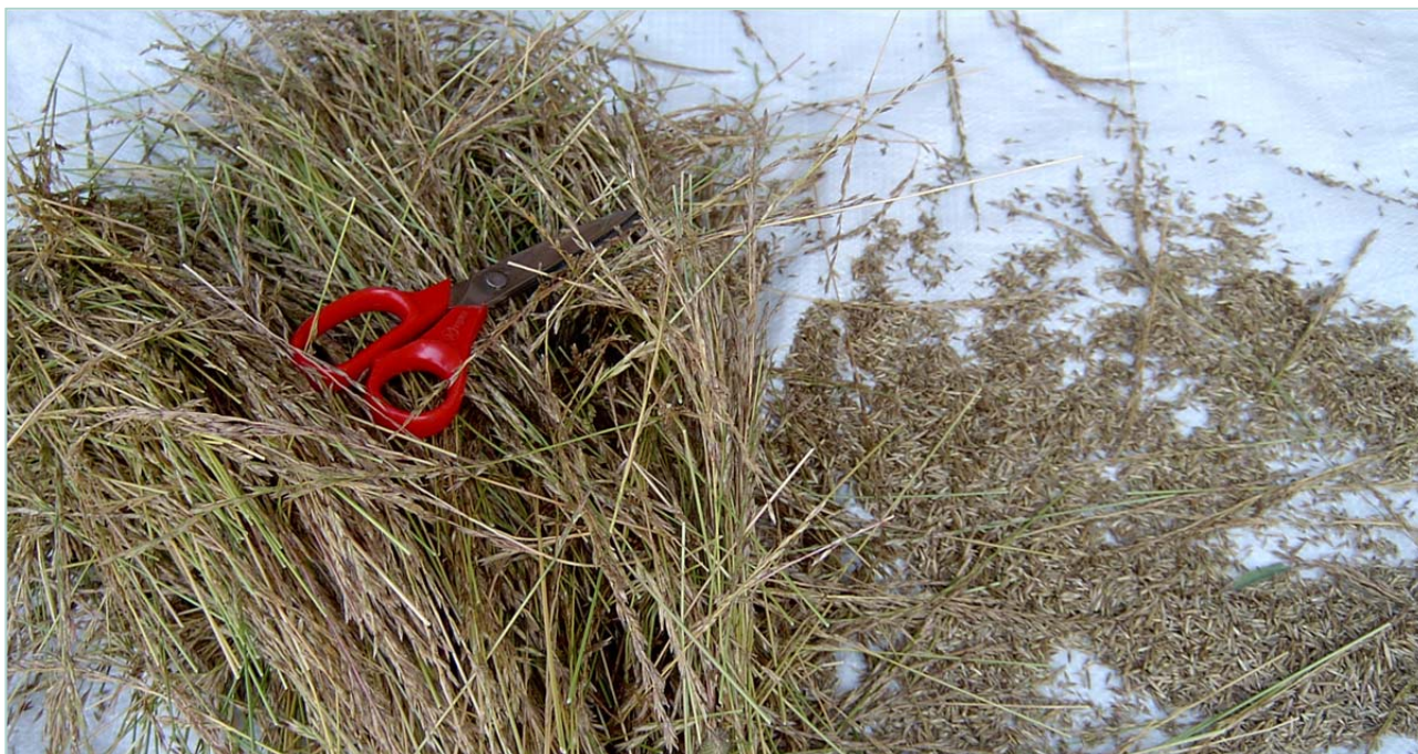
Frøhausting med saks er tidkrevande men sikrar reint frø. Her ser vi engsvingel.

Bevaring ved bruk-prosjektet skal ikkje halde seg til tradisjonelle frødyrkingsområde og eldre tiders dyrkingsmetodar. Det viktige er å legge forholda til rette for å få nye lokalsortar tilpassa dagens og framtidens klima og landbruksdrift. Det kan bli utfordringar med frøberginga, og ein må sjå på praktiske løysingar, gjerne forankra i tradisjonelle metodar for det enkelte distrikt. I regnfulle kystområde og område med svært kort vekstsesong kan det bli vanskeleg både med modning og hausting. Kaldt og vått vêr under blomstringa vil også kunne føre til lite frø, spesielt for raudkløver men også for grasa. For raudkløver er det viktig at det er nok pollinatorar til stades under blomstringa, som humler og andre insekt.