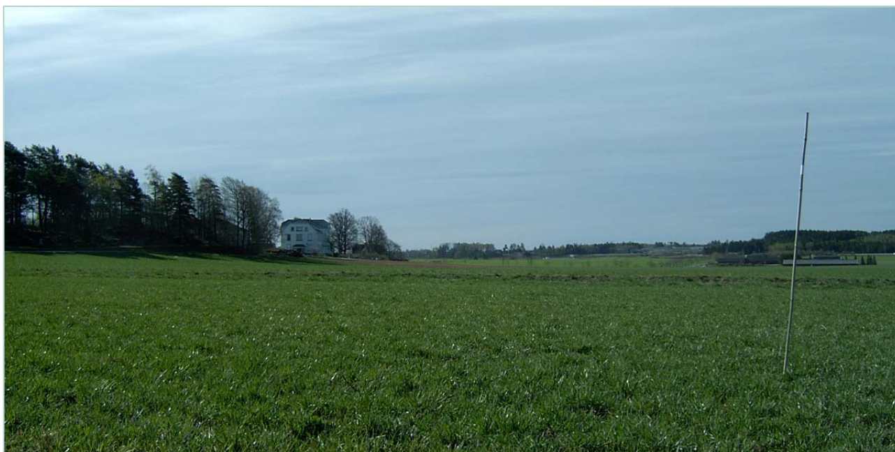
Forsøksfeltet på Kalnes blir dreve økologisk.

Ytterlegare fem frøfelt vart hausta i 2015. Stort sett er det timotei det har vorte hausta mest frø av. På det nordlegaste feltet på Tana vgs var det berre timotei som vart hausta. Det var ikkje uventa at raudkløveren vart borte under desse klimatiske forholda. Når det i tillegg vart brukt engsvingelfrø av «Flaten 2010», som viste seg vere mest urein vare, var dette resultatet som venta. Kalnes vgs fekk bra avling av alle tre artane. Her vart engsvingelen hausta med hjelp av den lokale landbruksrådgjevinga, som er næraste nabo til skulen. Timotei og raudkløver vart hausta av ansatte på skulen. På Voss jordbruksskule gjorde engsvingelen svært lite ut av seg i enga, og vart ikkje hausta. På Mo og Jølster var det også liten andel engsvingel og også lite raudkløver, så her vart det mest timoteifrø men også noko frø av dei to andre.