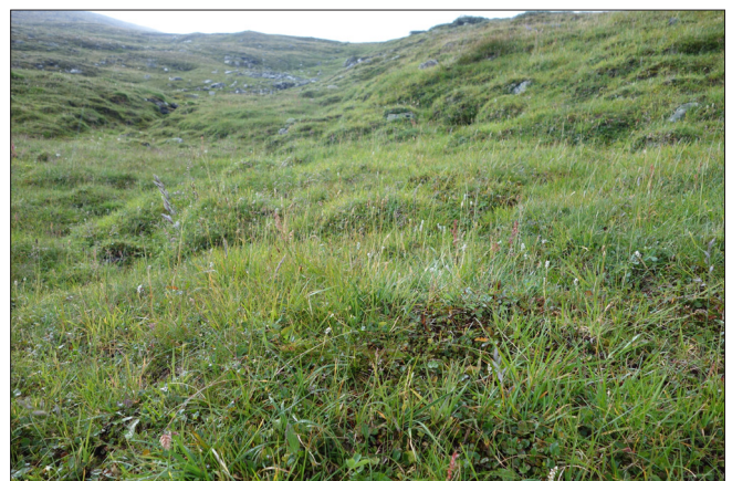
Grasrike lågurtenger er viktige beite for husdyr og rein.

Over skoggrensa finn vi typisk lågfjellsvegetasjon med dominans av vegetasjonstypen rishei som utgjer 29 % av snaufjellsarealet. Risheia, med dvergbjørk, blåbær, smyle og krekling, inntek heiareal som ikkje er for eksponerte. Lavhei rår på rabbar og andre eksponerte veksestader med 20 % av arealet. På rabbane er det også høgt innslag av den kalkkrevande vegetasjonstypen reinrosehei (6 %). Grunne grasmyrer, oftast av rik eller ekstremrik utforming, dekkjer 13 % av arealet. Snøleie forekjem i lesider der snøen blir liggande til ut i juli/august. Snøleia er oftast rike engsnøleie eller lågurtenger som utgjer 9 % av fjellarealet. Langs bekkar og i lisider med godt vassig opptrer frodige høgstau-deenger (6 %). Over 1300-1400 moh. tek mellomfjellsvegetasjon over med tørrgrashei, frostmark, mosesnøleie og aukande innslag av blokkmark.