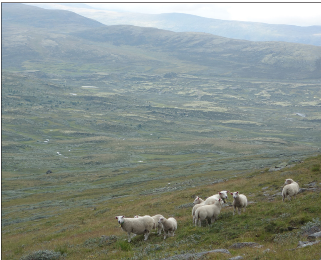
Sau ved Bekkelægret.

Oppdal østfjell er eit fjellparti med sør-nordgåande dalar og fjellformasjonar. Godt runda fjell eller høer når mange opp til kring 1600 moh. Fjella stig stadvis bratt opp frå dalane, andre stader er det slake hellingar i veksling med vide flyer. Botnar og kvelv ligg inn mot dei høgaste fjella. Det meste av kartlagt areal (83%) er snaufjell. Noko areal i Drivdalen og Vinstradalen, og etter dalgangen i bygda i nord, ligg under skoggrensa som går 900-1000 moh. i nord, men stig til jamt 1100 moh. oppover Drivdalen. 75% av arealet ligg 1000-1400 moh.