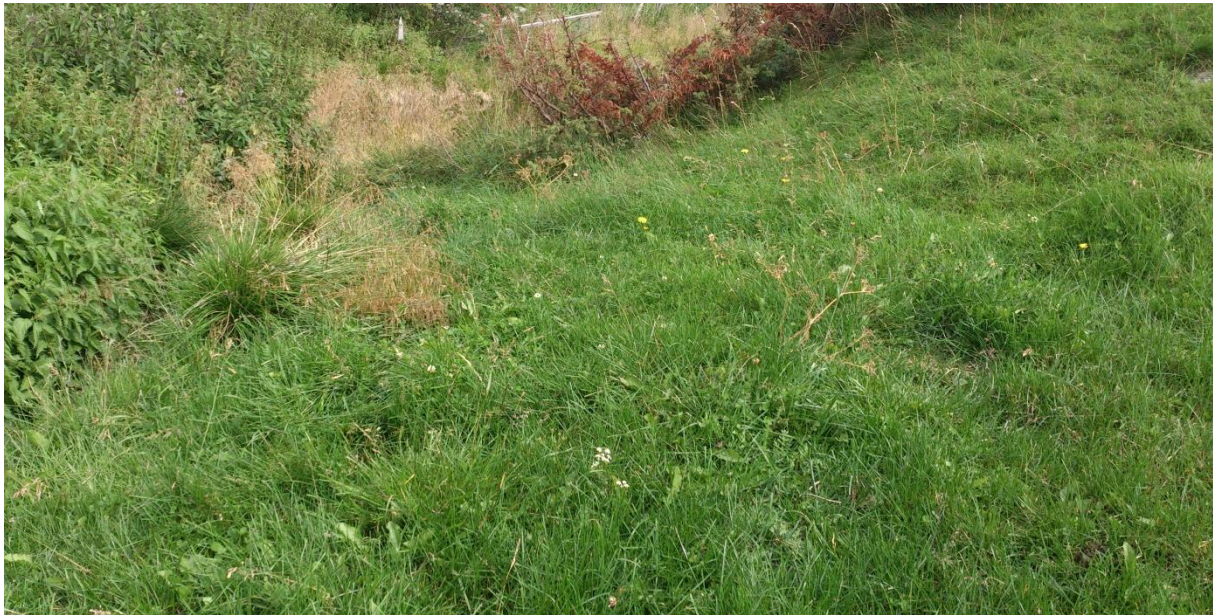
Foto 4. Innmarksbeite - middels fuktig, urterik grasmark med høy dekningsgrad av engkvein, gulaks, rødsvingel og rapparter – forsøksvert B.