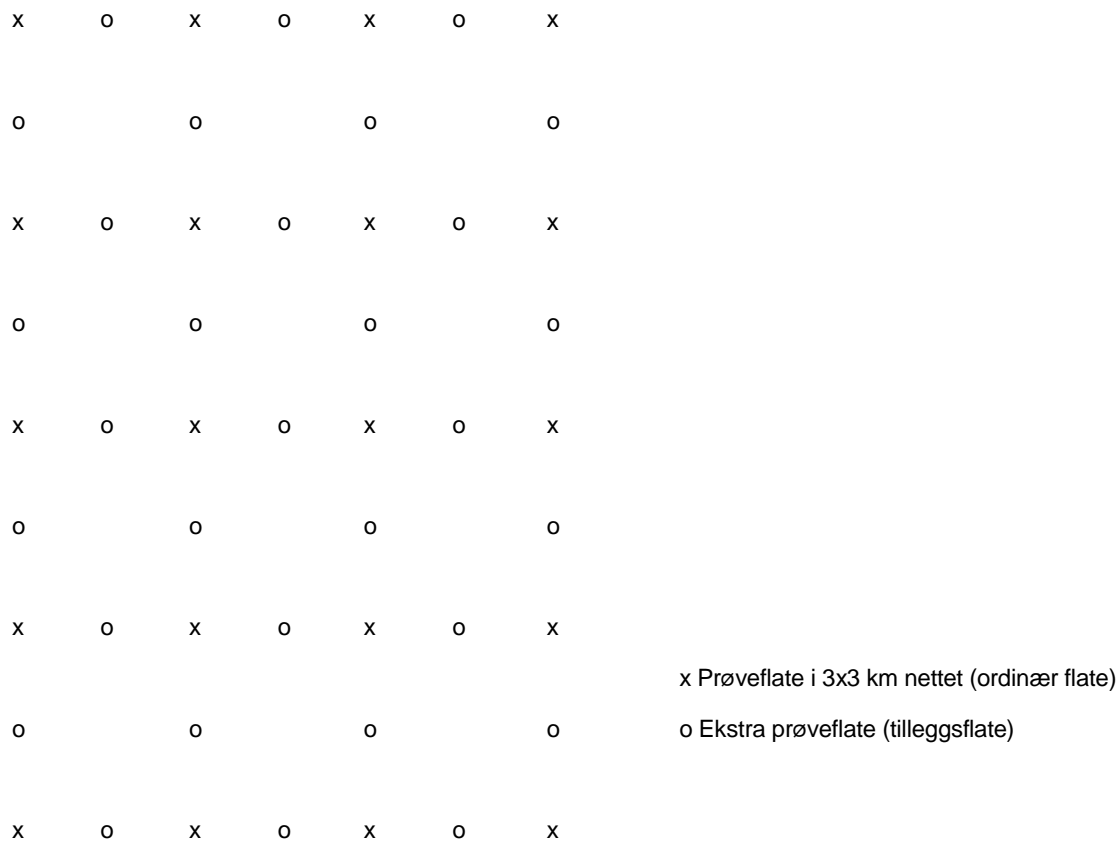
Figur 1. Utvidet nett av prøveflater i naturreservater med skog som vernetema.

Om lag en femtedel av alle flater som er innenfor naturreservater med skog som vernetema, vil bli taksert hvert år. De prøveflatene som tilfredsstiller kravet om at de må ligge helt eller delvis i skog blir etablert og målt i felt. Antallet flater som blir taksert kan det enkelte år bli noe høyere eller lavere enn en femtedel av det totale antallet flater som treffer verneområder, grunnet tilfeldigheter i hvordan flatene i det fortettede nettverket «treffer» verneområder det enkelte året.