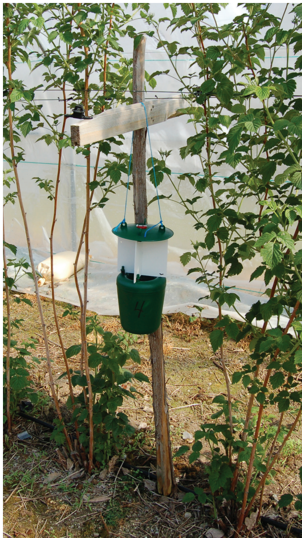
Felle for bringebærville.