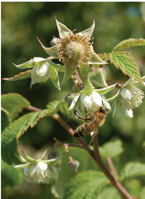
Bier og humler er viktige for bestøving.

BIOFORSK TEMA vol 7 nr 14 ISBN: 978-82-17-00990-0 ISSN 0809-8654