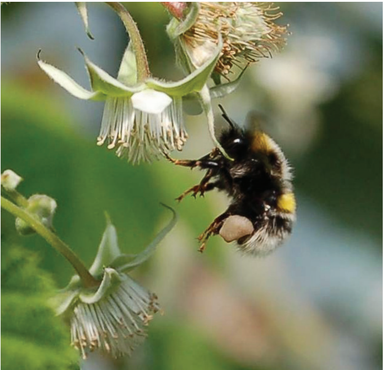
Bier og humler er viktige for bestøving.