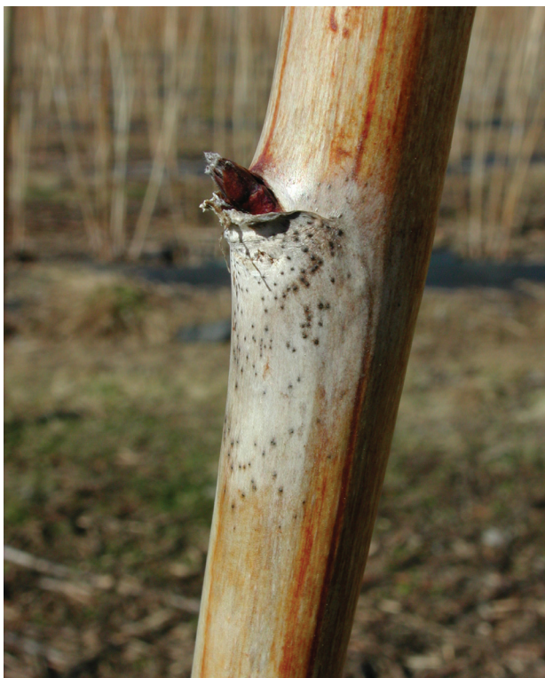
Skotsjuka på bringebærskot.