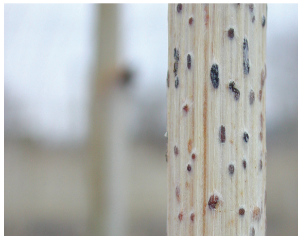
Gråskimmel på bringebærskot.