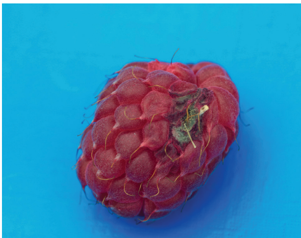
Gråskimmel på bringebær.

Bringebærbladmidd ( Phyllocoptes gracilis ) gjev karakteristiske gule flekker på oversida av blada hjå bringebær. Det vil vera samsvarande hårlause parti på undersida av blada. 'Glen Ample' er sterkt utsett for bladmidd som kan spreia seg med luftstraumar over forholdsvis store avstandar. Villbringebær og infiserte nabofelt er viktige smittekjelder og bør fjernast. Smitten kan også verta spreidd med reiskap, utstyr og folk som arbeider i feltet. Statskontrollerte planter er i utgangspunktet friske og oftast frie for bringebærbladmidd, men smitten kan fort koma inn frå vegetasjonen utanfor. Sein haustsprøyting med blanding av olje og såpe har god effekt.