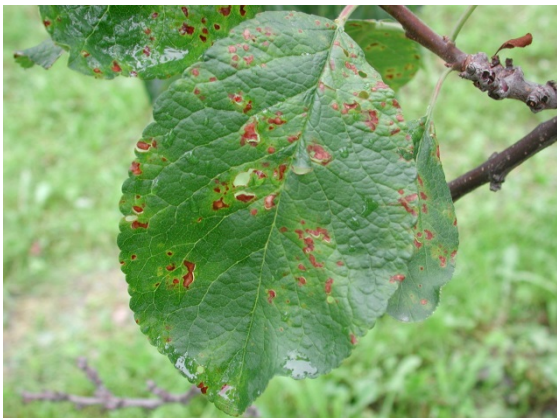
Bladsymptomer med nekroser i 'Mallard'