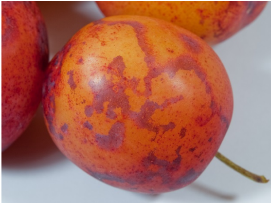
Fruktsymptomer i 'Reeves'