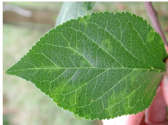
Svake bladsymptomer i 'Victoria'