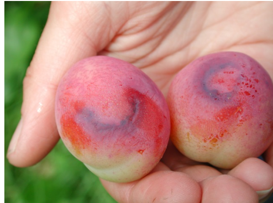
Fruktsymptomer i 'Victoria'