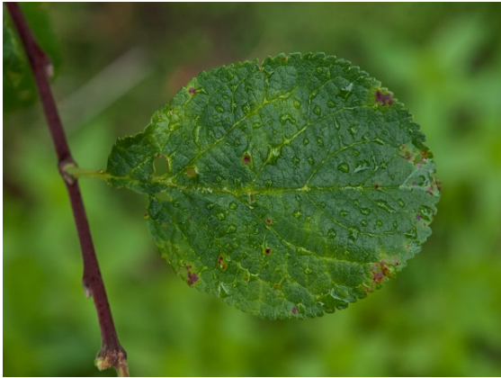
Sharkavirus - svake symptomer