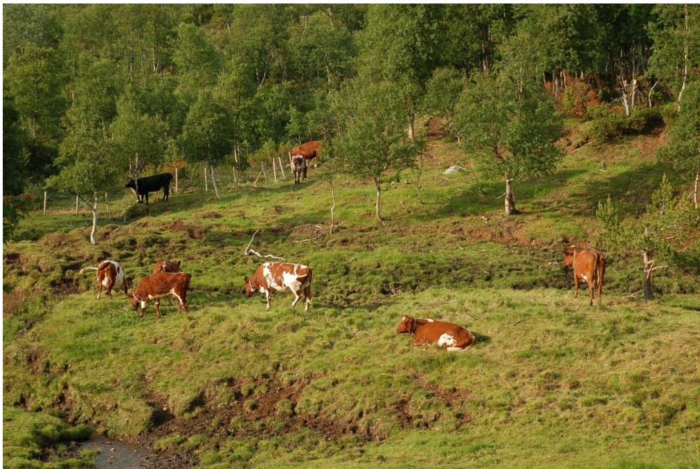
Figur 4. Utmarksbeitene representerer verdifulle arealer for matproduksjon både i Norge og Sverige. Bildet er tatt i Synnerdalen, Midtre Gauldal, Sør-Trøndelag fylke.

Ved CBM har man i samarbeid med Riksantikvarieämbetet og «länsstyrelserna i fäbodlänen» samt lokale brukere gjennomført et kartleggingsarbeid av hvilken type biologisk kulturarv som finnes i utmarksområdene, og hvordan man best skjøtter dette for å bevare de kulturhistoriske verdiene (for eksempel Ljung 2011 och 2013). Utmarkas betydning for lokalbefolkningen i grensetraktene mellom Sverige og Norge i løpet av 1800- og første halvdel av 1900-tallet har blitt belyst i flere bøker utgitt av CBM (for eksempel Kjellström 2012-2014). Videre har det blitt gjennomført en studie med formål å gi et bredt eksempel på potensialet for »hållbart entreprenørskap» basert på tradisjonell kunnskap og biologisk mangfold (Warmark et al. 2012).