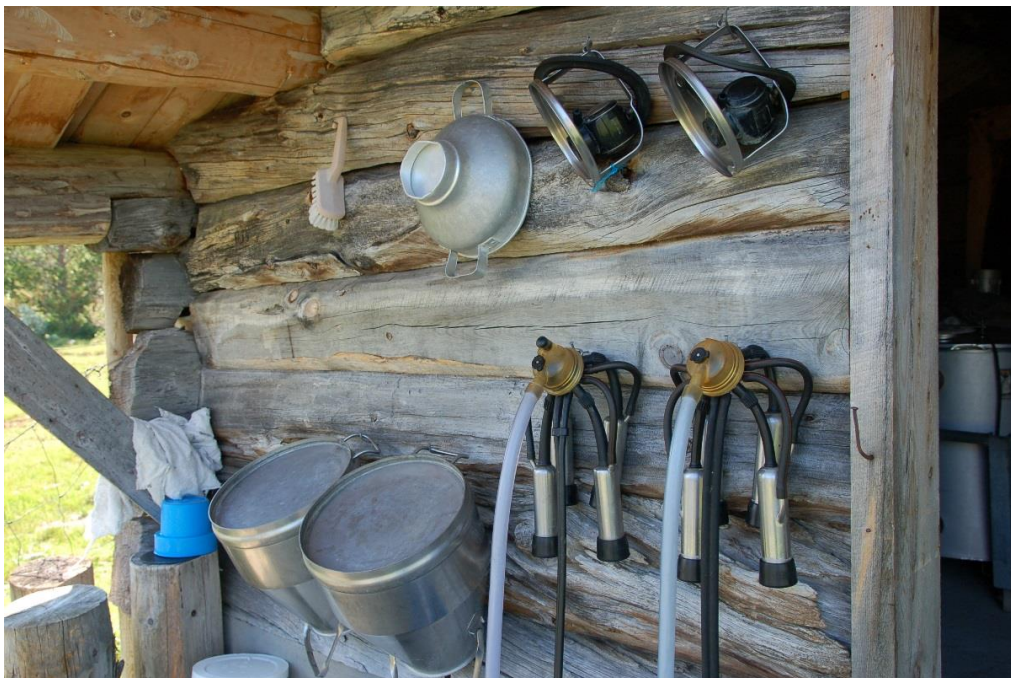
Figur 1. Det er i dag en økende etterspørsel etter den unike og lokale maten og opplevelsene knyttet til den, Nordistuvollen i Endalen, Midtre Gauldal kommune i Sør-Trøndelag.

Det er også slik at mange av områdene folk i dag oppfatter som «uberørt villmark» eller «ekte natur», er gamle kulturlandskap i gjengroing. Fjell-og skogslandskapene både i Norge og i Sverige har gjennom lang tid blitt utnyttet til seterdrift og anna utmarksbruk, og inneholder i dag en rekke fysiske og biologiske kulturminner, samt en omfattende immateriell kulturarv (Tunón et. al 2013, Bele et al. 2011, Bele et. al 2013, Bele & Norderhaug 2013, Bele & Norderhaug 2012, Ekeland 2008, Ljung 2011, 2013).