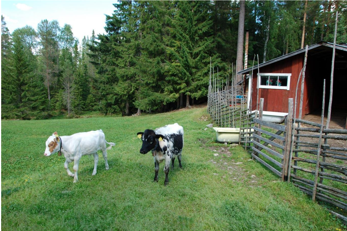
Figur 9. Kalver på beite på setervoll i Klövsjø.