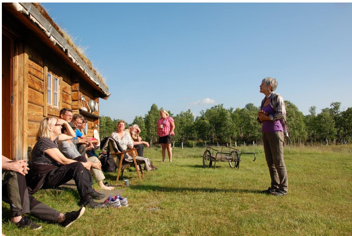
Figur 2. Ved Hiåvollan i Budalen tilbys overnatting, tradisjonell seterkost og historier knytta til seterlivet.

Å koble et steds historie og kulturlandskap til den lokale maten og de prosessene som leder fram til den, vil kunne gi reiselivsprodukter en merverdi som turistene verdsetter og er villige til å betale for. I Norge er en betydelig del av den lokale matproduksjonen fremdeles knyttet opp mot beitesystemer i utmarka, men også i Sverige forekommer det en viss matproduksjon som er basert på utmarkas beiteressurser. Disse beitesystemene har sitt opphav i lokale, tradisjonelle driftssystemer, og fremdeles er beiting med sau og andre husdyr helt avgjørende for å opprettholde tilleggsverdier («added values») som åpent landskap og biodiversitet i jordbrukets kulturlandskap. Bruken av tradisjonell økologisk kunnskap (TEK = traditional ecological knowledge) for å forsterke den lokale identiteten og for å markedsføre lokale matprodukter har så langt i liten grad blitt prøvd ut i Norge og i Sverige, selv om potensialet burde være stort (Tunón 2010).