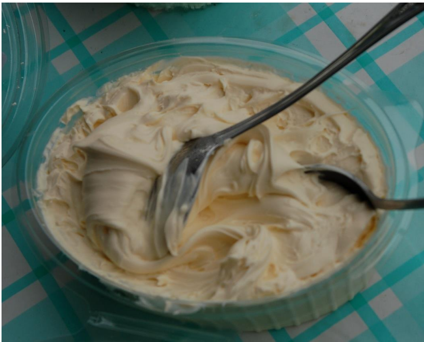
Figur 5. Ved å koble et steds historie mer direkte til maten, vil den lokale identiteten kunne styrkes. Bildet viser seterrømme fra Budalen.

Videre vil også Bioforsk si interne strategiske satsing innenfor temaet «terroir» være et relevant samarbeidsprosjekt knyttet mot et eventuelt forprosjekt (og senere hovedprosjekt). I dette prosjektet arbeides det med et grunnlag for å kunne trekke inn lokal kulturarv som en tilleggsverdi til lokal matvareproduksjon. I tillegg fokuseres det også på kvalitative analyser (av fettsyrer, vitaminer etc.), og hvordan de kan kobles mot geografiske opphav.