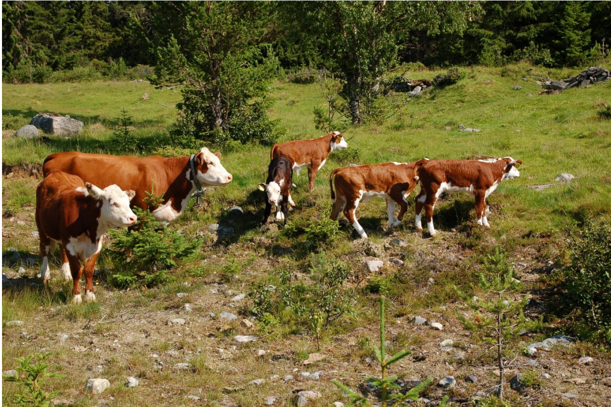
Figur 6. Gamle setervoller representerer gode beitearealer for Hereford. Bildet er fra Hede i Härjedalen. Jämtlands län.

biologiskt kulturarv i natur- och kulturvård samt entreprenörskap» for å sette mer direkte fokus på hvordan natur- og kulturverdier på norsk og svensk side kan bidra til bærekraftig verdiskaping.