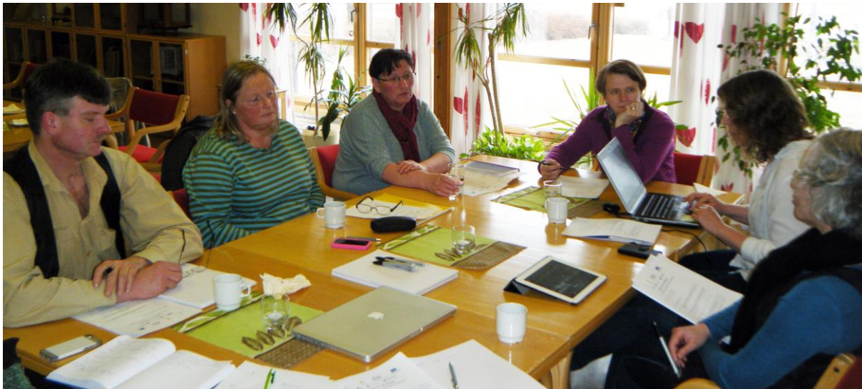
Figur 7. Fra gruppediskusjonene under workshopen på Stjørdal i April.

Målgruppen for småprosjektet var næringsutøvere/brukere, forvaltningen på ulike nivåer og fagmiljøer på svensk og norsk side. Totalt deltok 17 personer under Workshopen i April, med målgruppen bredt representert. Foruten CBM, Proneo og Bioforsk, deltok representant(er) fra Värmlands säterbrukarförening, brukere fra Stjørdal, Lierne og Midtre Gauldal, länsstyrelsen i Dalarna, länsstyrelsen i Jämtland, Fylkesmannen i Nord-Trøndelag, Matnavet Mære, Miljødirektoratet og Innovasjon Norge. Deltakerliste er lagt ved (Vedlegg 3).