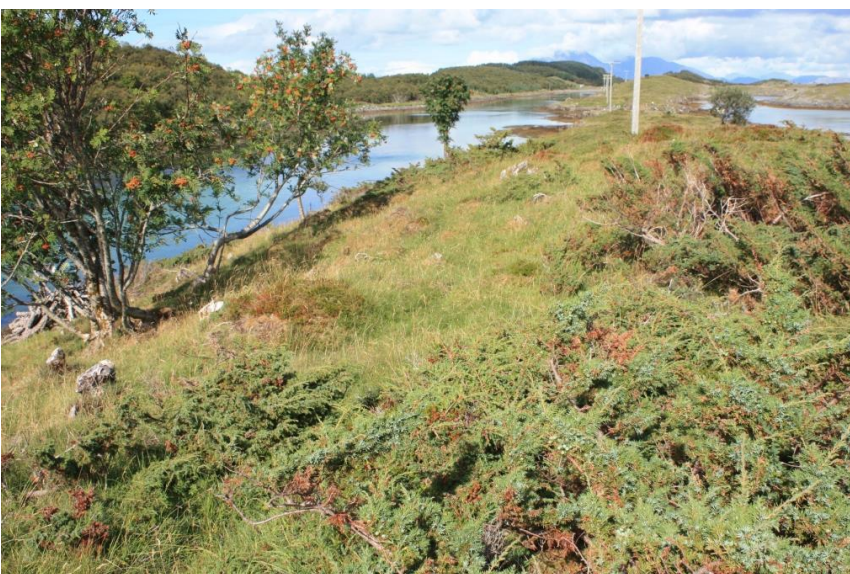
Bilde 3: Storvokst einer i område hvor det tidligere har vært ryddet skog. Det anbefales å rydde bort eineren.