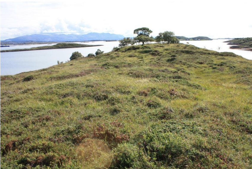
Bilde 2: Litj-Slotterøya ligger lengst sør i kystlyngheia på Sørgården, og har god forekomst av røsslyng.