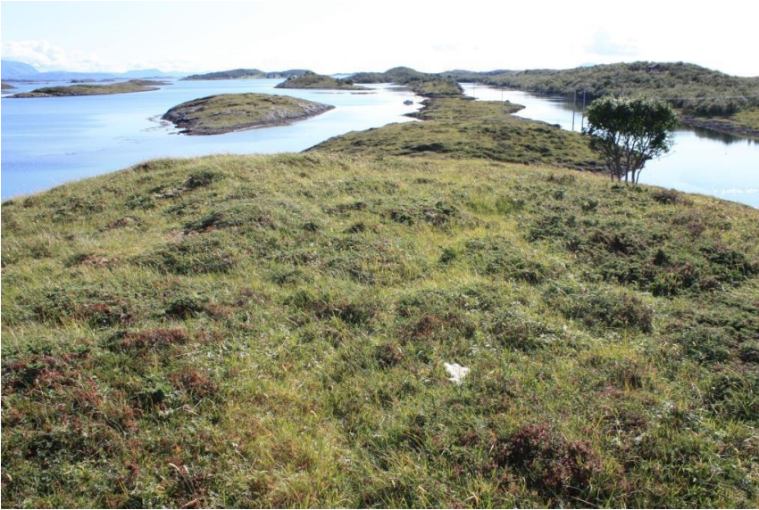
Bilde 1: Oversiktsbilde over sørdelen av Drægern.