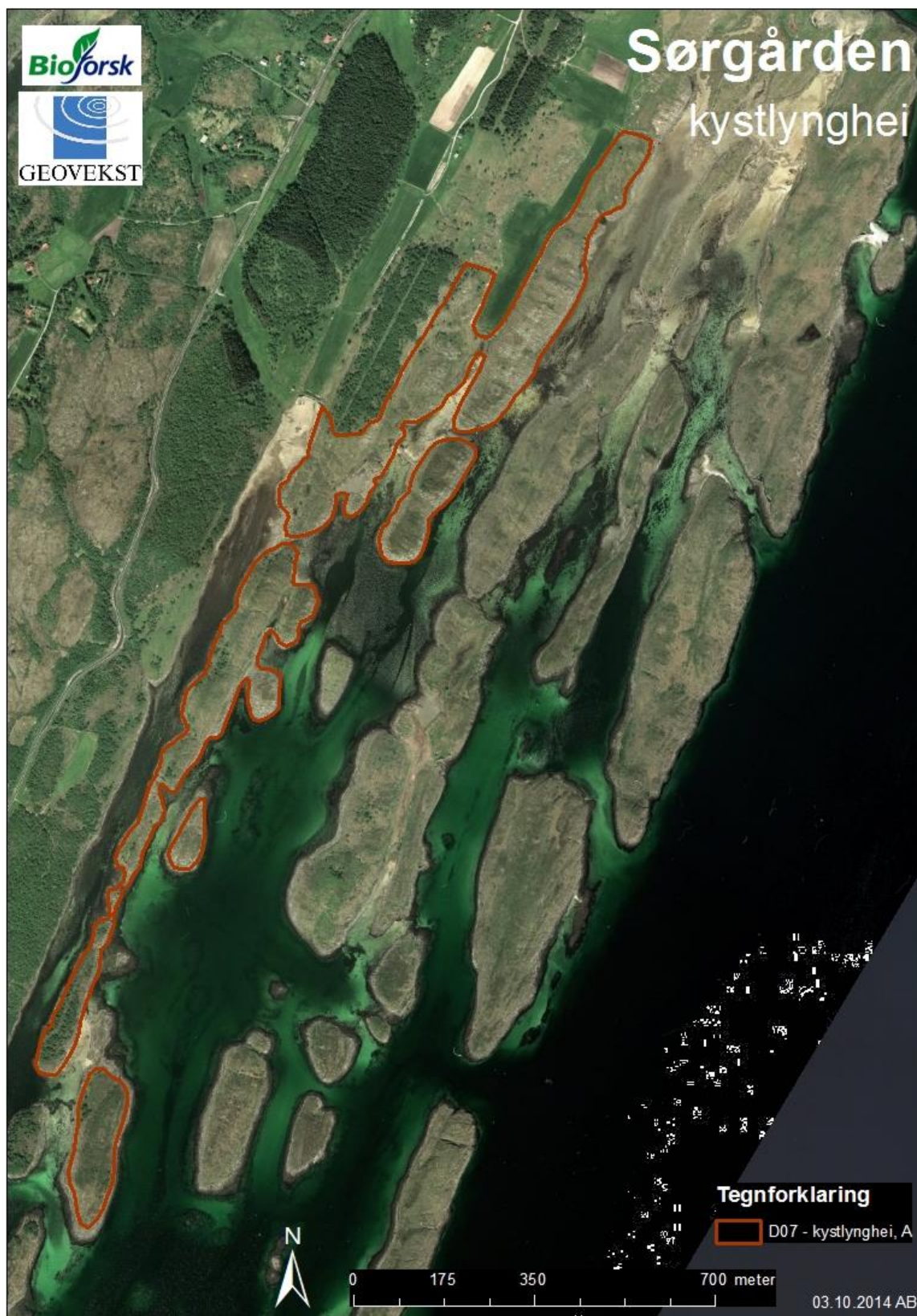
Figur 1: Arealavgrensing av kystlyngheilokaliteten på Sørgården i Blomsøya, Alstahaug kommune. Sørgården inngår i lokaliteten «Blomsøya, Bumarka-Sørgården» som er blitt verdisatt i naturbasen til verdi A, svært viktig.