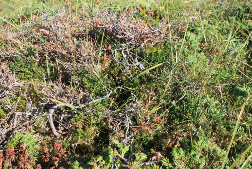
Bilde 4: Gammel, forvokst røsslyng på Drægern. Ved sviing kan vi få spiring av ny røsslyng, og kanskje vil andelen røsslyng øke.