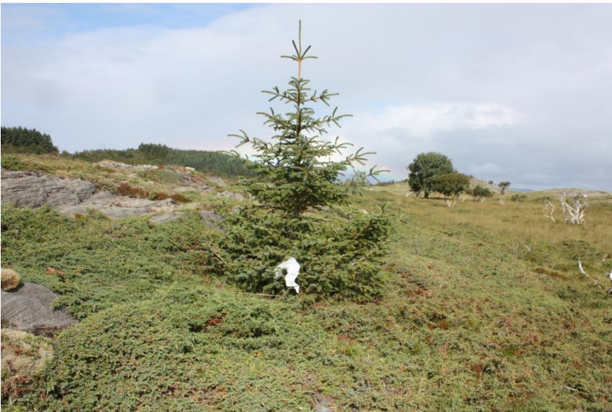
Bilde 5: Selvsådd sitkagran på nordenden av Landfast-Risøya. I området finnes også mange små sitkagraner.