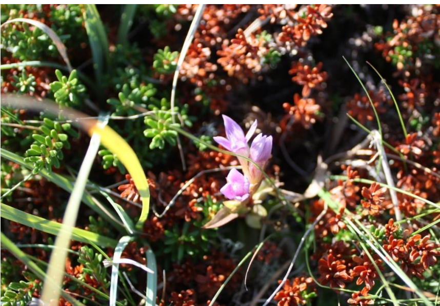
Bilde 6: Bittersøte i blomst på Drægern sensommeren 2014.