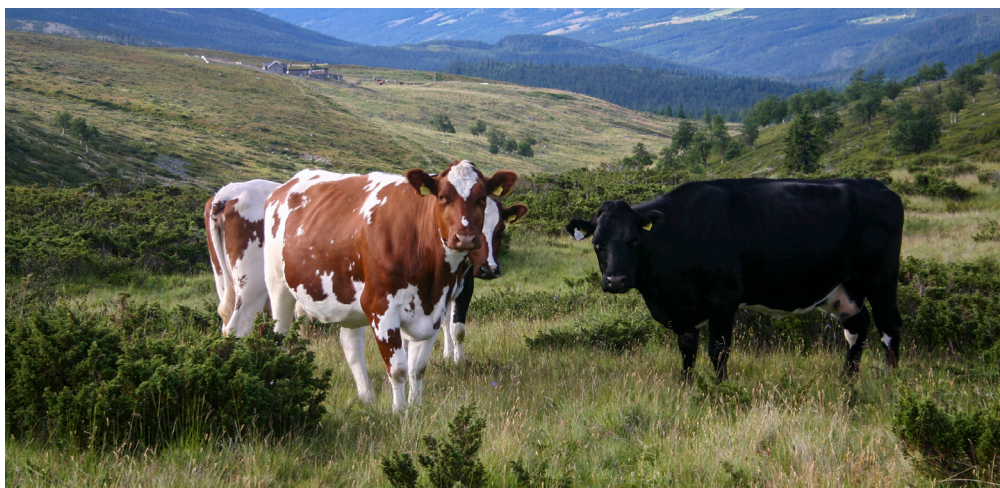
Utmarksbeite kan være et betydelig velferdsgode for blant annet storfe, hest, sau og geit med tanke på å kunne utøve normal atferd og få fysisk og psykisk stimulasjon.

Landbrukets nettoutslipp av klimagasser kan dessuten reduseres gjennom tiltak for økt binding av karbon i jord og biomasse.