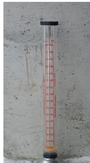
Bilde 4. Vestfold frøavlslag disponerer dette flowmeteret.

Etter tresking kan det ligge store mengder spillfrø på jordoverflata. Av hensyn til seinere arts- eller sortsbytter i frøavlens bør dette frøet få spire, og dermed bli uskadeliggjort, før pløying. Dette