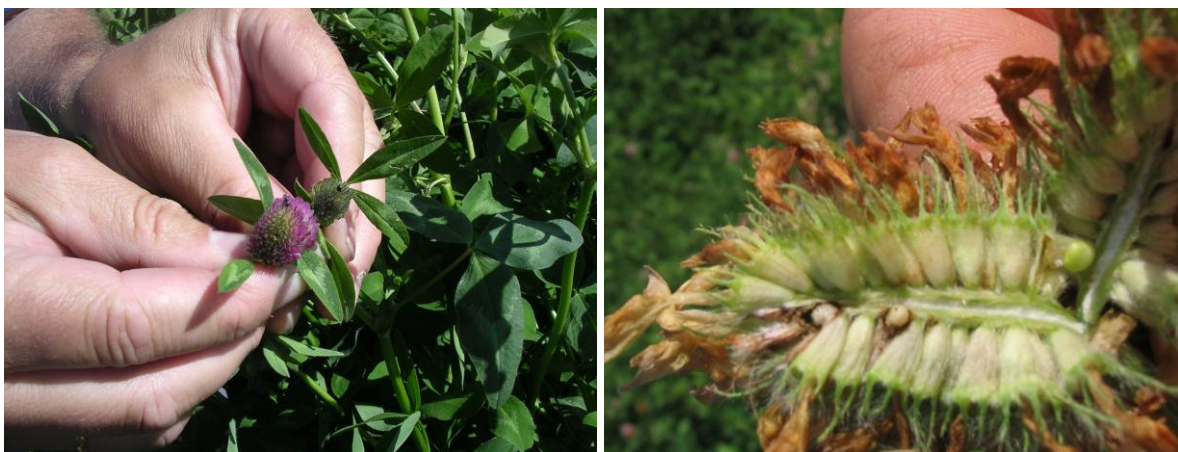
Bilde 2. Voksne individer (t.v.) og larver (t.h.) av rødkløversnutebille.

Av rødkløversnutebiller fins det tre arter på Østlandet. Felles for dem er at det voksne individet er 1-2 mm langt og overvintrer i vegetasjonen rundt frøengene, spesielt i strøsjiktet i barskog. Når dagtemperaturen flere dager på rad kommer opp i ca 20°C, flyr de inn i frøenga og gnager tett i tett med små hull i bladene (næringsgnag eller hullgnag, som ikke må forveksles med sneglegnag som er mer uregelmessig og der det ofte blir igjen rester av bladets overflatehinne. Deretter legger snutebillene egg i blomsterknoppene. Eggene klekkes til larver som gnager på frøanlegga, seinere frøene, inni belgene i hvert blomsterhode. På ettersommeren forpupper larvene seg, og etter klekking kan de voksne individene igjen foreta næringsgnag på bladene før de flyr til overvintringsstedene rundt frøenga.