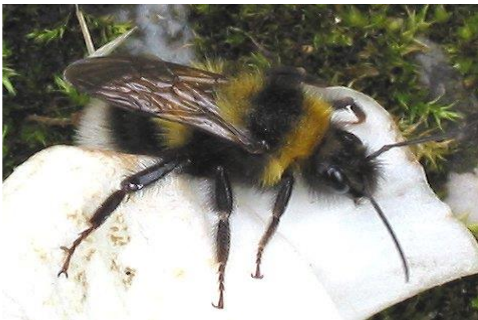
Bilde 1. Hagehumla har lang tunge og er effektiv til å pollinere rødkløver. Den trives også

Noe av det viktigste vi kan gjøre for å få opp kløverfrøavlingene er å legge til rette for de naturlige, ville pollinatorenene. Rødkløver er selvsteril og har behov for insektpollinering for å sette frø. Danske forsøk med insektbur i frøenga har vist at både honningbier og humler kan pollinere rødkløver, men humlene er mye mer effektive enn biene. Sammenlikna med bier er humler mindre følsomme for låg temperatur eller dårlig vær, og de har høyere arbeidstempo og lengre arbeidsdager. Vi regner derfor at ei humle pollinerer like mange blomster som 1,5 - 2,5 bier. Årsaken til variasjonen er at det er stor forskjell mellom ulike humlearter. På grunn av kløverblomstens 6-12 mm lange kronrør er langtunga humler som hagehumle, åkerhumle og kløverhumle mer effektive enn korttunga humler som steinhumle og jordhumle.