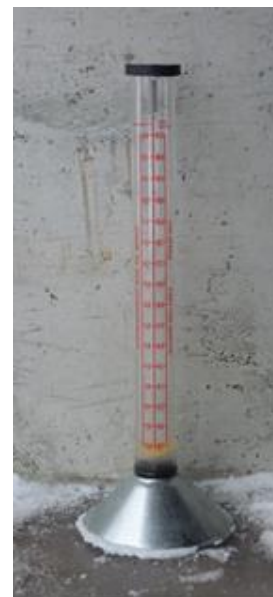
Bilde 1. Vestfold frøavlerlag disponerer dette flowmeteret.

Vanninnholdet i frøet vil hele tiden stå i likevekt med den relative fuktigheten i tørkelufta. Når vanninnholdet i frøet er kommet ned i ca 18% må vi derfor begynne å slå av vifta om natta, da luftfuktigheten er høyest. Seinere blir det aktuelle tidsrommet for tørking mindre og mindre, til sist bare noen timer midt på dagen. Frøet skal tørkes helt ned til 12% vann, tilsvarende en luftfuktighet på ca 50%. For å ta ut de siste prosentene kan det være aktuelt å sette varme til tørkelufta slik at luftfuktigheten går ned. For hver grads oppvarming faller den relative fuktigheten av tørkelufta med ca 4 prosentenheter.