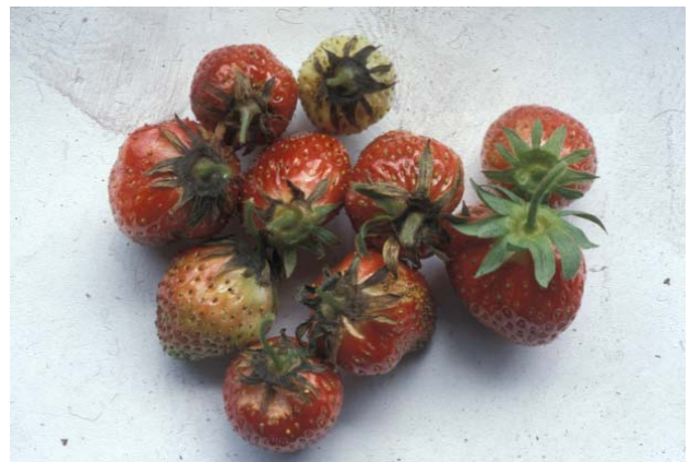
Angrep av Xanthomonas fragariae på begerblad