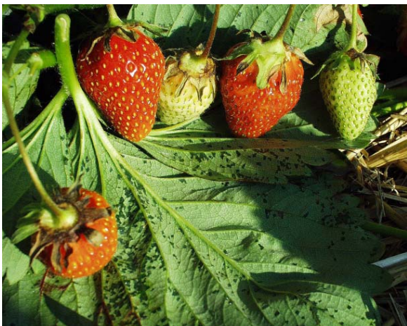
Angrep av Xanthomonas fragariae på blad og begerblad