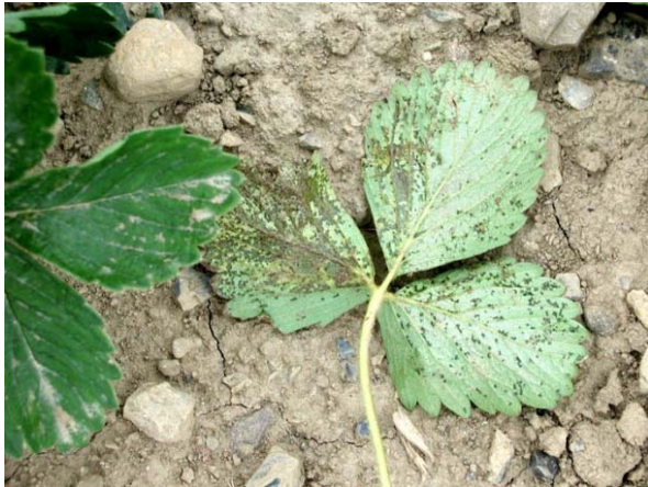
Kraftig angrep av Xanthomonas fragariae