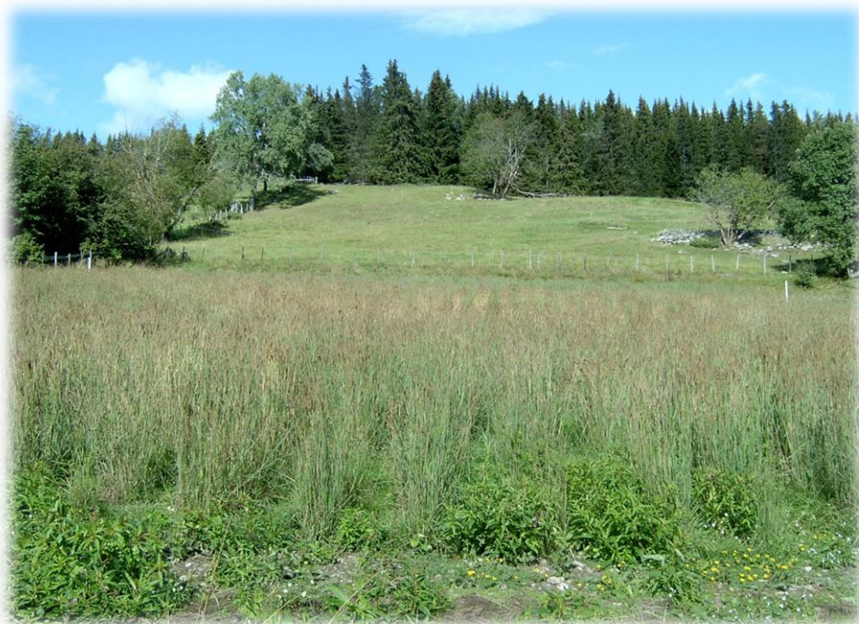
Frøfelt timotei Bioforsk Løken 2006

15 sortar og 132 accesjonar frå Nordisk Genbank, kvar representert med 12 planter. Sortane er Norild, Salten, Vigdis, Fure og Løken frå Noreg, Laura frå Danmark, Arni/Kauni frå Estland, Stella og Darimo frå Nederland, Lifara og Leopard frå Tyskland, Skrzyszowicka og Skava frå Polen, Merifest frå Belgia og Severodinskij frå Sovjet.