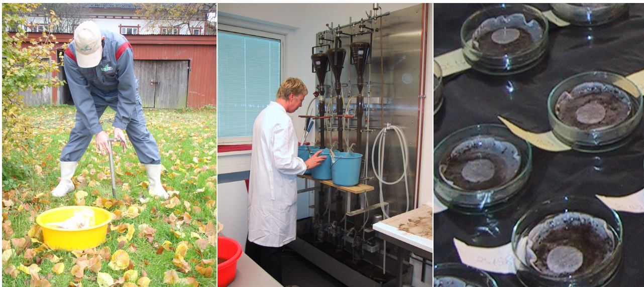
Figur 2. Innsamling og utdrivning av nematoder fra jord. Se teksten for detaljer.