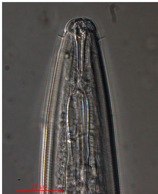
Figur 1. Ulike utforminger av hoderegion med munnleder hos to typer nematoder. Plantespisende, altspisende og en del rovnematoder har en munnbrodd (spiss nål) til å stikke hull i celler og byttedyr med (a). Bakteriespisende nematoder har en rør- eller traktformet munn uten munnbrodd (b).