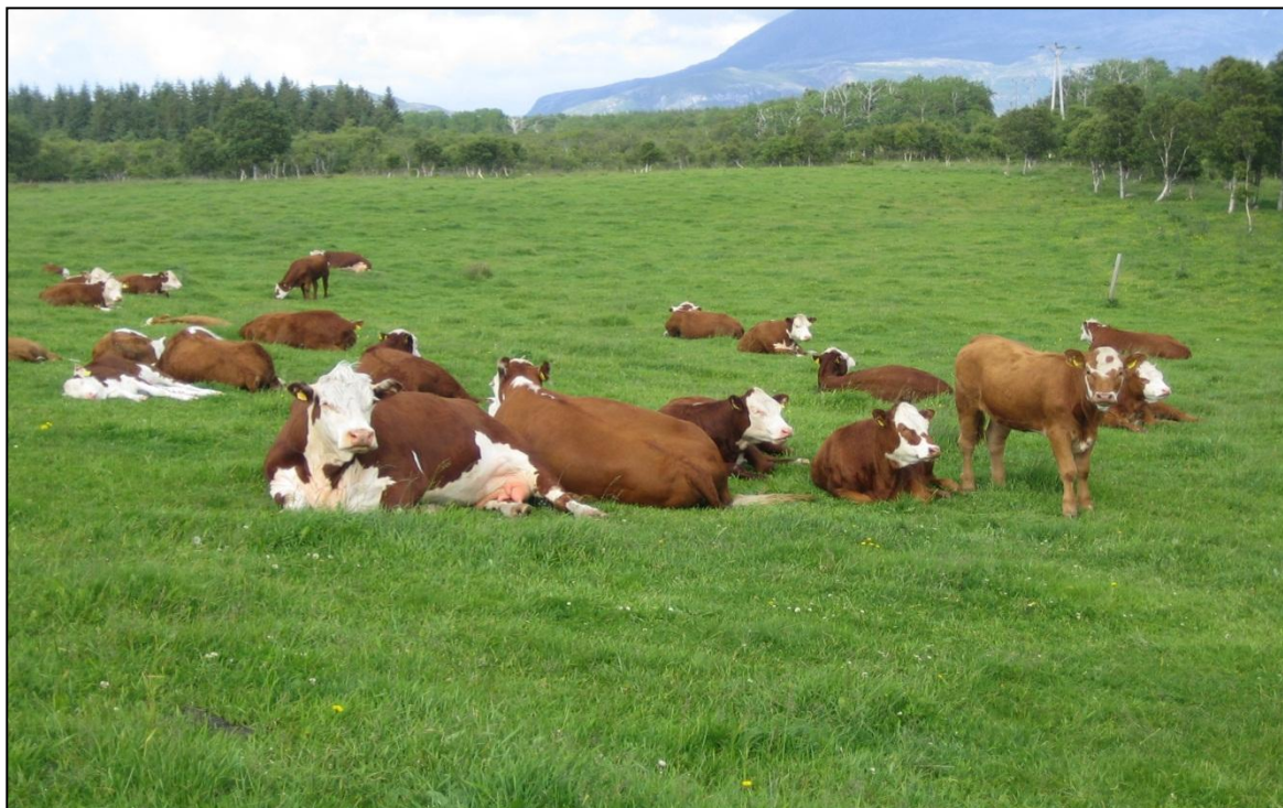
Fig. 3 Ammekyr med kalv på kulturbeite.

Tradisjonelt var storfe det viktigste husdyret når det gjaldt beitebasert kjøttproduksjon på utmarksbeiter. Ungdyra var i utmarka og melkekyrne var på setervollene. Endringer i dagens storfeproduksjon har ført til at fokuset nå er på melkeproduksjon, med store enheter og høy avdrått som hovedmål. Dette har ført til en nedgang i bruken av beiter og i produksjonen av storfekjøtt. Vi har fått en dreining i norsk matproduksjon fra å være basert på en ressurs det er mye av, grovfôr og beite, til en ressurs som må importeres, kraftfôr. Studier gjort i Irland og Sverige har vist at beitebasert kjøttproduksjon kan gi den samme tilveksten og kjøttkvaliteten som tradisjonell kjøttproduksjon basert på kraftfôr (French et al. , 2001, Ahnstrøm et al. , 2009). Storfe som i hovedsak spiser friskt beitegras har et høyere innhold av flerumettede fettsyrer (omega-3) i kjøtt og melk enn dyr på mer kraftfôrbaseret fôring (Woods & Fearon, 2009). Det er vist at beitebasert kjøttproduksjon gir kjøtt med et høyere innhold av umettede fettsyrer (omega-3) enn kjøttproduksjon basert på kraftfôr. Beitebasert kjøttproduksjon egner seg godt for både kastrater, kviger og kalver (fig. 3).