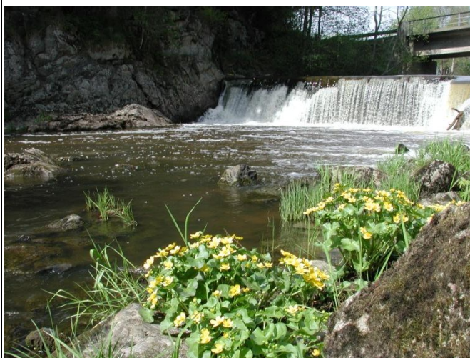
Figur 1b. Fra prøvetakingsstedet ved Kure.