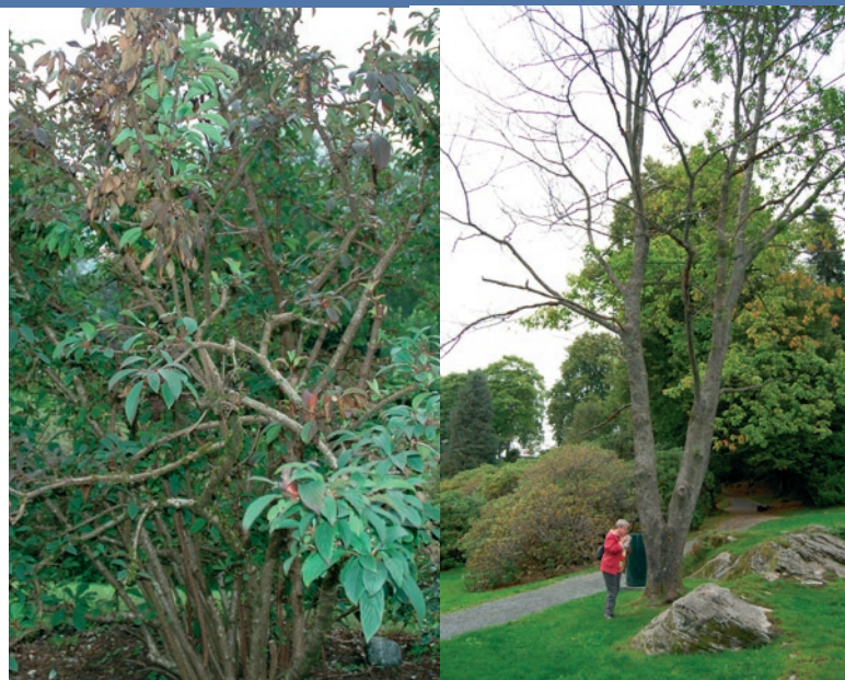
Krossved og eik får blødende kreftsår på stammen og dør.

Kontaktperson ved Bioforsk Plantehelse: María-Luz Herrero