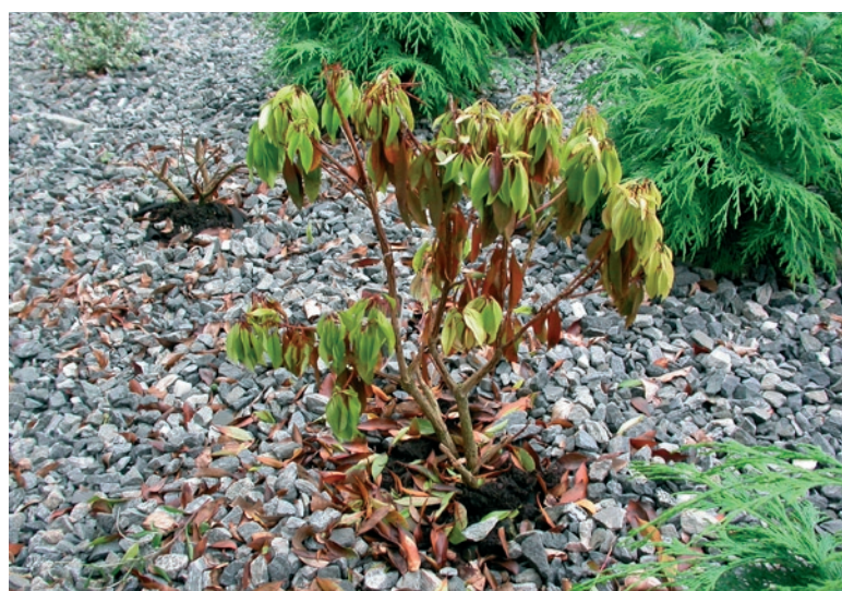
P. ramorum på pyramidelyng. Foto: V. Talgø.

BIOFORSK TEMA vol 4 nr 4 ISBN: 978-82-17-00502-5 ISSN 0809-8654 Fagredaktør: Dir. Ellen Merethe Magnus Ansvarlig redaktør: Forskningsdirektør Nils Vagstad Forsidefoto: Erling Fløistad