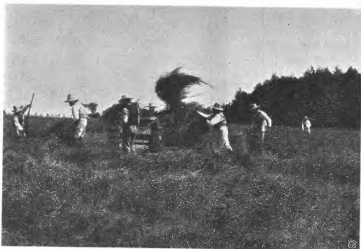
Straffanger under høstningsarbejde.

Dette vil naturligvis afhænge af koloniens størrelse, og ved de større kolonier — kanalgravninger, dæmningsarbejder og store dyrkningsarbejder — bliver administrationen mere omfattende; men jeg saa i Bernau, at 15—20 fanger under markarbejderne lededes af en vogter.