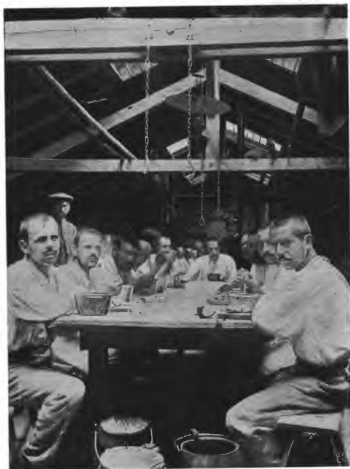
Straffangerne spiser middag i barakken.

Ved de store myr dyrkningsstationer, som f. eks. Bernau, overtager stationen, foruden at lede mange private dyrkningsarbeider, ogsaa opdyrkningen af myrstrækninger, der tilhører gaardbrugere. Stationen faar myren overleveret i fuldstændig raa tilstand og dyrker den saa ved hjælp af fanger . Efter et vist antal aar, hvilket afhænger af myrens godhed og dyrkningens lethed, kan saa vedkommende grund-