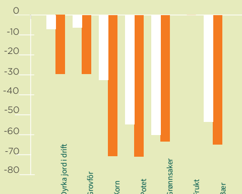
ENDRINGER I AREAL OG ANTALL FORETAK I NORDLAND I PERIODEN 2003 TIL 2016: