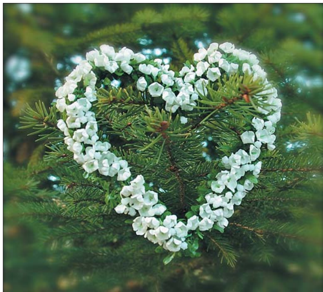
De første juletrærne ble pyntet med blant annet papirblomster.

www.skogoglandskap.no, tlf: 64 94 80 00, Redaktør: Camilla Baumann, Produksjon: Svein Grønvold, Grønvolds Bildebyrå, Trykk: Follotrykk AS 2010, Opplag 3000