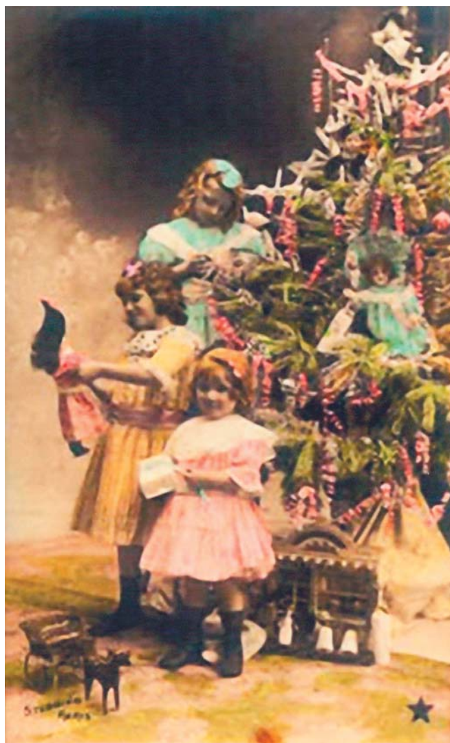
Gammelt, udatert julekort.

Jul (av norr. Jöl eller jòlablót ) er et fellesnordisk navn på den opprinnelige hedenske feiringen av vintersolverv. I Skandinavia hadde man minst to slike fester, eller blot, hvert år – en ved midtsommer og en ved midtvinter. I store deler av det førkristne Nord-Europa feiret man også ved vintersolverv i siste halvdel av desember. Man feiret for et godt år og for at solen snudde og det gikk mot lysere tider igjen. De eldste av våre juleskikker stammer fra de hedenske festene – skikker som hovedsakelig dreier seg om mat og drikke. Juleølet overlevde kristningen av landet fordi folk nektet å gi avkall på det. Klokkelig nok valgte de styrende instanser å gi den gamle tradisjonen ny symbolsk mening, heller enn å avskaffe den. I mesteparten av Europa har feiringen fått et kristent navn; På engelsk brukes navnet Christmas , på tysk heter det Weinachten . I Frankrike sier man Noël ,