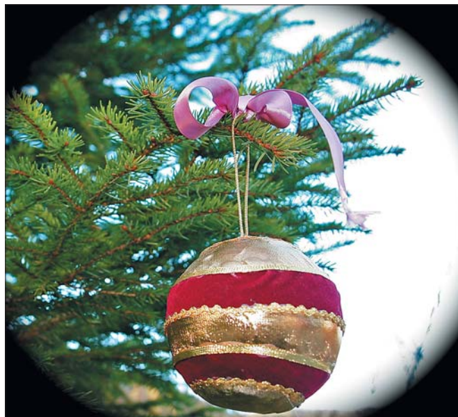
Senere kom lys, glitter og annen pynt i tillegg.

men i Skandinavia har høytiden fått beholde sitt gamle navn Jul . Engelskmennene har faktisk bevart navnet Yuletide som en arkaisk form.