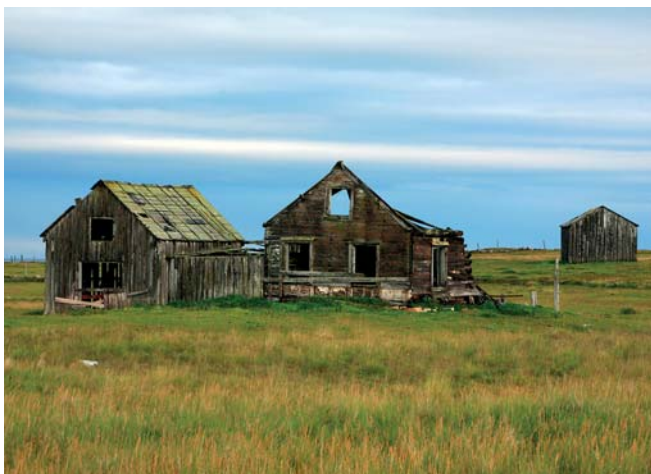
Et eksempel på bygninger i sterkt forfall og areal ute av drift, Vadsø.

Utleie av arealer har imidlertid en viss betydning for framtidig gjengroing da mange bruk leier ut mindre areal enn de selv søkte arealstøtte for tidligere. Noe av dette arealet er sikkert i bruk til aktivitet som ikke er berettiget arealstøtte (for eksempel hestehold). Vi har imidlertid grunn til å tro at dette også inkluderer mye areal som vi på sikt vil se gro til, da vi på 3Q-flater i Nord-Norge finner at det er mer gjengroingsareal på areal som er leid ut enn på areal som tilhører hovedbruket.