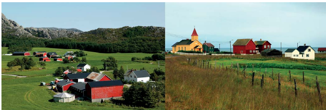
Det er større sjans for at et foretak langs kysten av Nordland skal fortsette med drift enn et bruk i jordbruksregion 9 Kysten av Troms og Finnmark. Bildene viser et aktivt jordbruk i begge regionene. Fra Vega i Nordland og Vadsø i Finnmark.

I tillegg har vi sett at når det gjelder nedlegging av driftsenheten så er det en større tendens til nedlegging gitt at en befinner seg på kysten av Troms og Finnmark, eller i skogområdene i Nord-Norge enn i andre områder. Med hensyn til hvilke arealer som ikke leies ut, så er det lokalisering i fjellområdene og skogområdene som i seg selv bidrar til reduser sannsynlighet for utleie av arealene.