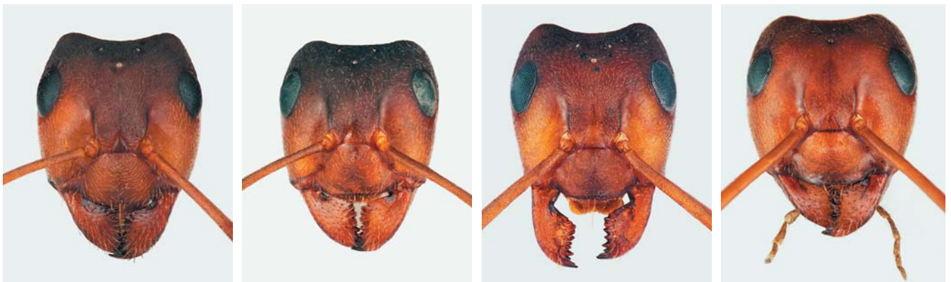
Portrett av fire kjente norske arter av underslekten "Kløftheademaur", som tilhører slekten skogmaur.

Stadig flere maurarter oppdages i Norge. Den første oversikten over maur i Norge er fra 1880 og inneholder beskjedne 16 arter. I dag kjenner vi totalt 54 utendørslevende arter. Så sent som i 2008 ble to arter oppdaget, nye for Norges fauna. I tillegg til de etablerte utendørslevende artene kommer arter innført med menneskelig aktivitet.