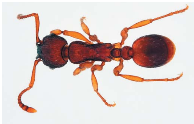
De to sist oppdagede maurartene i Norge er foreslått å hete "tørrmarkeitermaur" ( Myrmica specioides ) (t.h.) og "brunlig sauemauro" ( Formica cunicularia ).