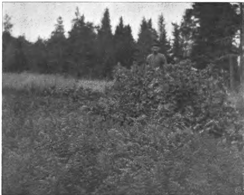
Gulerøtter og hestebønner, Mæresmyren 1911.

(2 og 4 hl.), mens der har været en smule nedgang for de to største mængder (6 og 9 hl.)