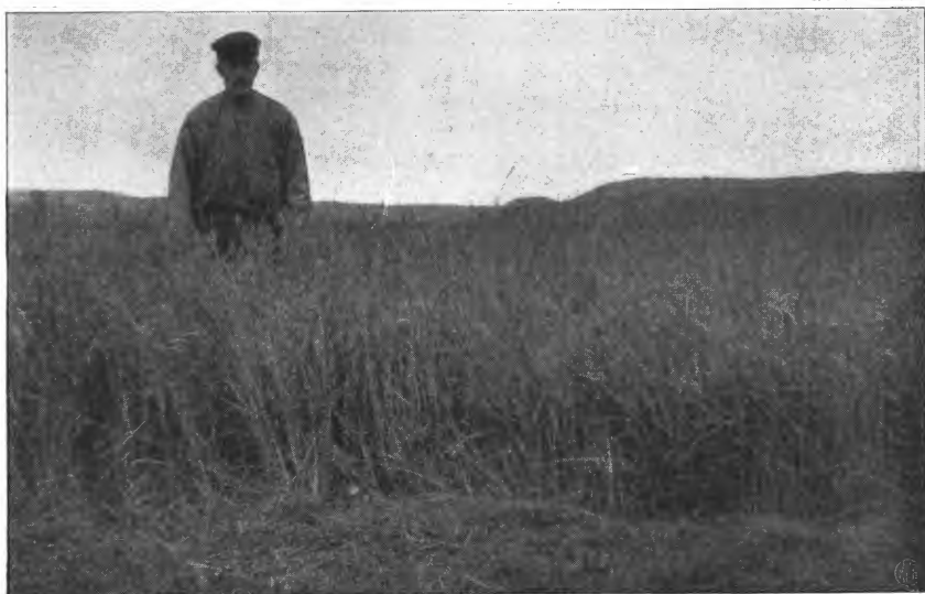
3 aars timoteieng, Mæresmyren 1911.