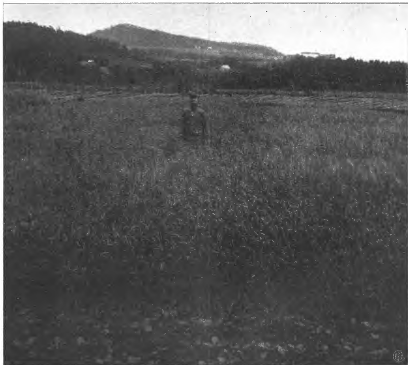
Byg i juli 1911, tilhøire sandkjørt, tilvenstre uten sand.