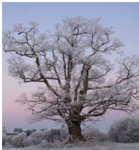
Eika på UMB, Ås.

Det første treet som ble fredet ved lov i 1914 var eika "Den gamle mester" ved Krøderen, som Jørgen Moe skrev et dikt til i 1859.