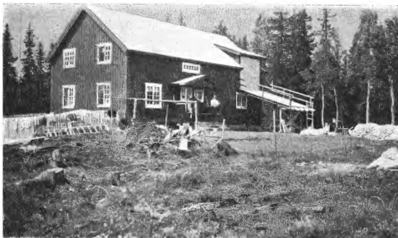
Fig. 3. Kombinasjon, første utbygging. Myrbruk i Flendalen, Trysil. Kun 8 da. fastmark. (J. Narud fot.)

Størrelsen på disse bruk er 75—100 dekar, hvorav ca. 6 dekar er fastmark og ligger utenom selve bruket. Myrbrukene herefter blir betydelig større, på ca. 150 dekar. Nordre del av Flendalsfeltet bestod av tjern og flymyr og var ufremkommelig for folk som fe. Der blev tatt 3700 m. kanal og bygget 1070 m. vei langs feltet. Veien bygdes billig. Kanalfyllen blev utjevnet, hvorefter et ca. 20 cm. gruslag påkjørtes. Myren består delvis av utmerket grasmyr og av overgangsmyr.