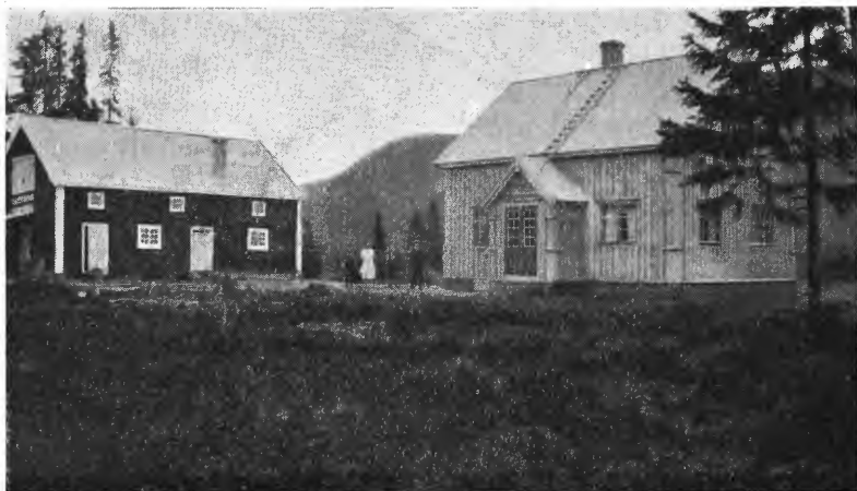
Fig. 2. Bureisingsbruk ved Jordet i Trysil, bygget 1932.

bindelse bør nødvendigheten av en grundig dybdeboring ved grøfteanlegg på grunnere myr understrekes. Det er et særdeles viktig arbeid som det ikke alltid er anledning til å ofre tilstrekkelig tid på. Antagelig er det flere enn mig som mere enn en gang har hatt ergrelse av sine grøfteanlegg av den grunn.