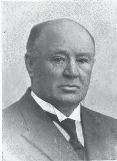
Stortingsmann Magnus Tvedten.

Utvalget for Undersøkelser over jordbrukets driftsforhold, grunnlagt 1911, er kanskje for tiden den mest