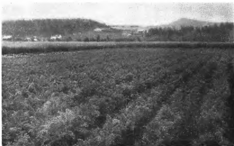
Fig. 2. Gulrot, Mæresmyra 1936.