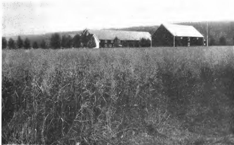
Fig. 1. Perlehavre, Mæresmyra 1936.