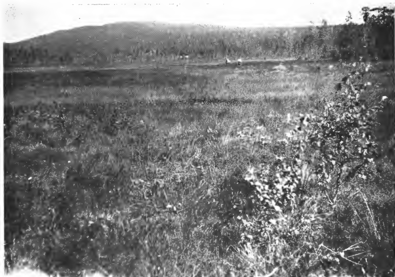
Fig. 1. Fra Bjumyren beliggende ved veien til Flatåsen seter (gressmyr).