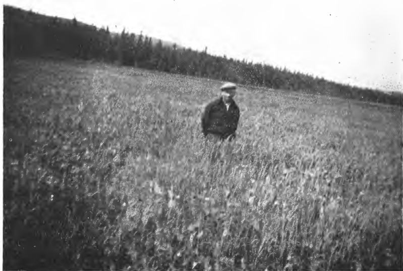
Fig. 2. Fra Momyren tilhørende Jønsberg landbruksskole (grønnfôravling).

460 og ca. 630 m, så en del ligger jo temmelig høit. Dette er bl. a. tilfelle med myr nr. 249 og 251 (Graslandkjølen og Storløkjølen), men de skulde allikevel være brukbare til engdyrking.