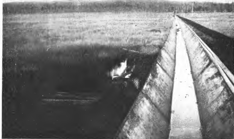
Fig. 3. Fra Gulltjernmyren (fløtningsrenne av jernplater).

når man undtar myr nr. 343 (Gåsmýren) og noen få mindre myrer. De andre er mest gressrike mosemyrer som til dels inneholder noe strøtorv. Myr nr. 343 er gressmyr og ligger meget heldig til for opdyrking. Det samme kan sies om myr nr. 310 (Astridkjølen) ved Trysilveien. Denne er innkjøpt av Elverum jordstyre og er tenkt utnyttet som tilskuddsjord til småbruk eller mindre gårdsbruk.