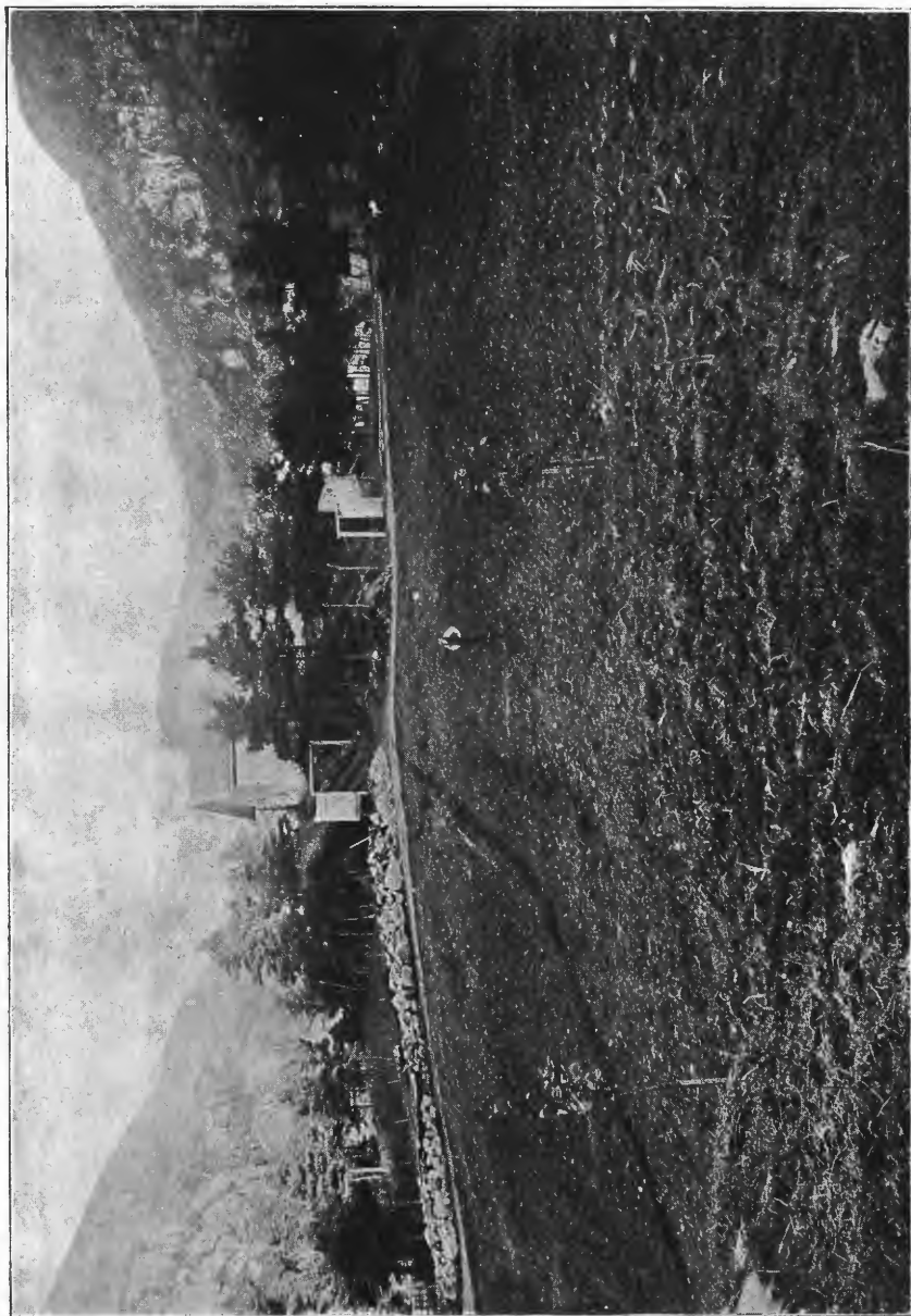
Opdyrket myrstrækning ved Tennebækken, Askøen.