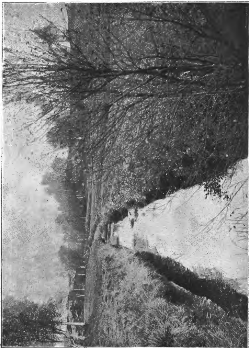
Hovedgrøft i myrdirkningsfelt paa Birkeland i Fane.