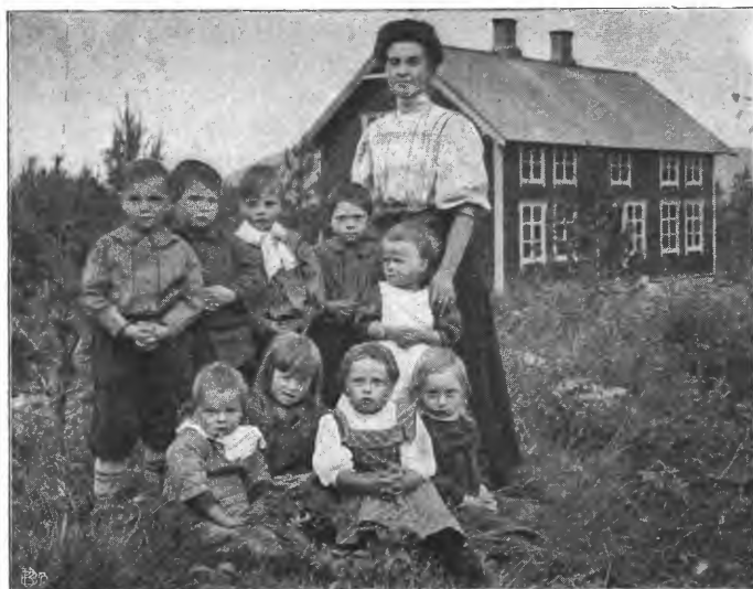
Verkstedbygning og barnehave

det gir interesse, det tar deres kræfter i bruk og utvikler dem og gir avveksling i arbeidet. Haandverk eller husflidsarbeide benytter vi kun, naar der ikke er tilstrækkelig arbeide ute. Skogplantning ogsaa, men endda kun i liten utstrækning, da vi ikke har rukkit det, men den plantede skog staar pent. Det har glædet mig at se, at »Norges Vel« har tat op spørsmaalet om jorddyrkning ogsaa for straffanger og tvangsarbeidslemmer. De samme hensyn taler for anvendelsen av dette arbeide likeoverfor disse. Som den bedste anstalt, bygget paa myr- dyrkning, vil jeg i forbindelse hermed faa lov til at henlede opmerk- somheten paa Witzwyl i Schweitz .