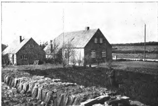
Fig. 5. Fra Wiesmoor, Vest-Tyskland. Nybygget småbruk. Stikktorvdrift.

ble nyttet var av så store dimensjoner at det bare har interesse under forhold hvor tusenvis av dekar ensartet jordsmonn skal dyrkes på kortest mulig tid.