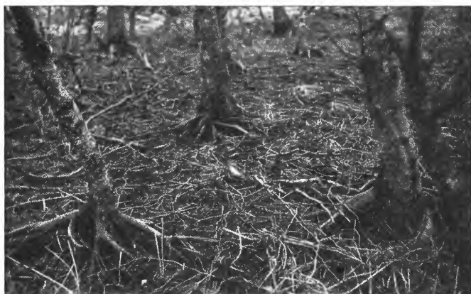
Fig. 3. Fra Centralgaarden, Store Vildmose, Danmark. Jordsvinn i eldre løvtreplanting på mosemyr.

årevne eltetorvanlegg. Driften var i full gang, og det ble også forberedt produksjon av formbrenselpulver på myrarealer med tynt torvlag.