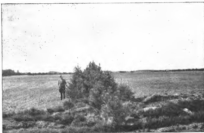
Fig. 2. Fra Vest-Jylland. 3 rekkers lehegn av nåletrær. Hvitgran ytterst og Contortafuru i midten.

landsmuseet på Schloss Gottorp i Schleswig. Her oppbevares nemlig en rekke interessante myrfunn som skriver seg fra steinalderen og utover til 5.—6. århundre. Videre oppbevares i konservert stand forskjellige profiler av mineraljord og myrjord. Med dr. Schlabow som ciserone fikk jeg også anledning til å se det berømte likfunn som er gjort på Doms Moor ved Windeby. Liket, som ennå befant seg i glasskiste på laboratoriet, er av en 14 års pike. Det er anslått å stamme fra tiden omkring Kristi fødsel og skal være et av det best bevarte likfunn fra denne tidsalder. Når en ser funnet hvor hvert menneskelige trekk er bevart over et tidsrom av snart to tusen år, blir en slått av myrenes enestående konserveringsevne.