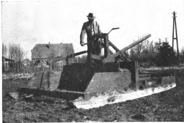
Fig. 6. Fra Emsland, Vest-Tyskland. Tuehøvel. Redskap til planering på myr.

derfor stor vekt at dette sjikt stadig har en tilstrekkelig tykkelse. En må derfor være oppmerksom på at dette sjikt svinner inn etter hvert som formoldingen skrider fram, slik at ny ukultivert torv etter hvert kommer med i matjordlaget.