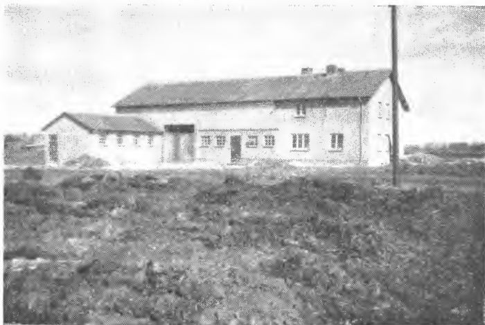
Fig. 4. Nybygt hus på bureisingsbruk på Søndre Vium ved Tarm på Jylland. Låve og stovetuis er samanbygde, som er det vanlege også mange andre stader i Europa.