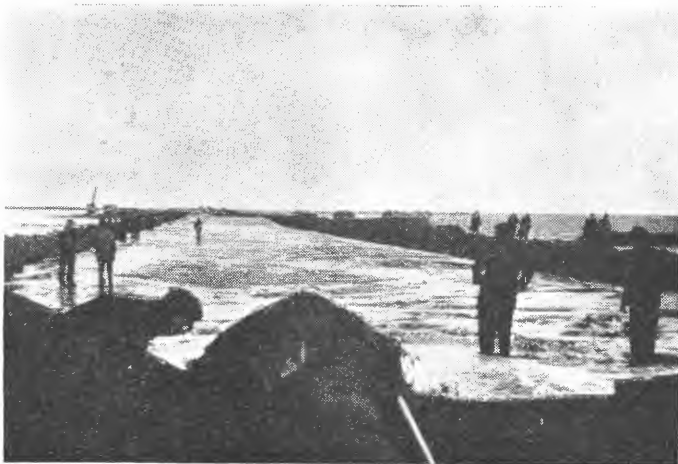
Fig. 5. Bygging av demning mot havet. Flytande jordmasse blir pumpa opp frå havbotnen og brukt til demning, «dike-kropp».