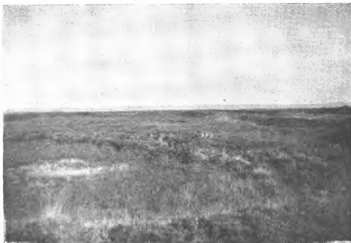
Fig. 2. Frå Rømø, ukultivert dansk hede.

gåande, stor plog til å bryta sund aurbellelaget. Plogen går ca. 0,9 m djupt og tek ca. 1,2 m breie forer. På det viset får dei blanda mineraljord med humuslaget, og ved slik djuppløying kan ein spara mest all detaljgrøfting. Det viser seg at året etterpå smuldrar denne jarn-aurbella nokså lett for vanleg jordarbeiding; men i mange år framover blir det store avling-striper i åker og eng på slik djuppløgd jord. Plantene trivst ikkje så godt i undergrunnsjorda i den første tida.