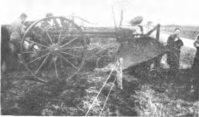
Fig. 3. Stor plog til å bryta aurdelle (tysk: Ortstein) med i Schleswig-Holstein.

på 20 år med 4,5 % p. a. i rente. Dei 3 første åra etter at arbeidet er ferdig er avdragsfrie; seinare skal det svarast 7,6 % pr. år (= rente + avdrag). Etter desse reglane har det blitt godkjende 948 nydyrkingsfelt, i alt 1.173.740 dekar, frå 1940 til 1954. (Til samanlikning kan nemnast at frå 1918 til no er det her i landet nydyrka ca. 2 mill. dekar.)