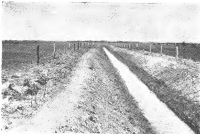
Fig. 6. Nyplanta hekk (til vinstre) på kanalkant i Schleswig-Holstein. Både langs vegar, langs kanalar o. l. stader vert det lagt vinn på å få opp gode hekkar.

det av beste jorda som finst. — Salt frå havet gjer ingen skade, for det blir raskt utvaska når marsken blir turrlagt og jorda blir godt drenert.