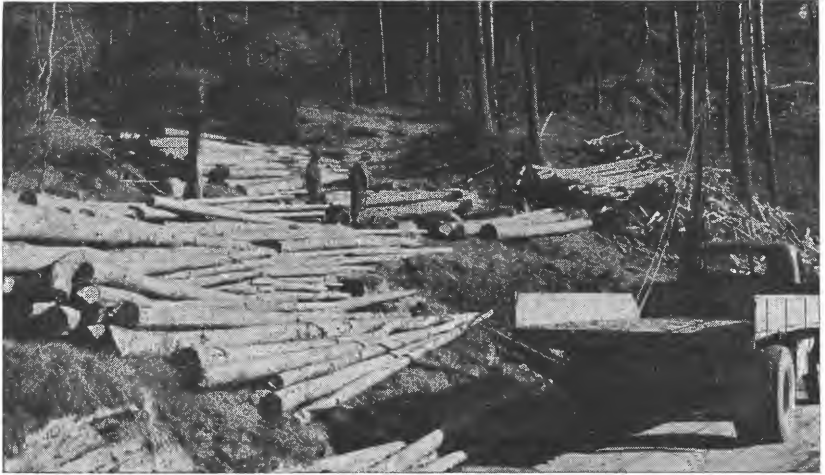
Tømmerdrift i plantefelt.

Det er rekna med 2.500 kg mjølk pr. ku og 1,5 gangslam (22,5 kg slakt og 2,7 kg ull) pr. søye.