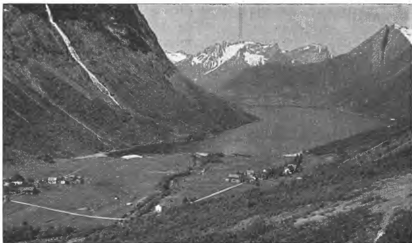
Dyrka jord i dalbotnen, og skogreisingsmark opp mot dei blå fjell.

berre dårlege utmarksbeiter og halvring vedskog. Dette er ille i ein landsdel der storparten av gardane var alt for små frå før. For vestlandsk landbruk er det derfor i dag ei stor og livsviktig sak å ta utmarka inn att i produksjonen. Berre på den måten kan mange bruk gi familien ein rimeleg leveveg i framtida.