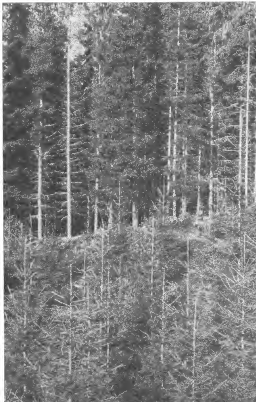
Dei største har vakse i 45 år, dei minste i 10 år.

Økonomiske utrekingar for ting som ligg så langt inn i framtida er sjølsagt nokså usikre, og svara vert aldri «rette». Men i dette