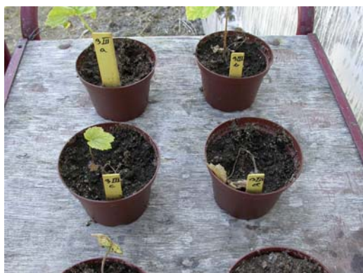
Figur 20. Potteforsøk, ledd 3 / Harmony 75 WSB, 3 uker etter sprøyting. Foto: 12.07.2005.