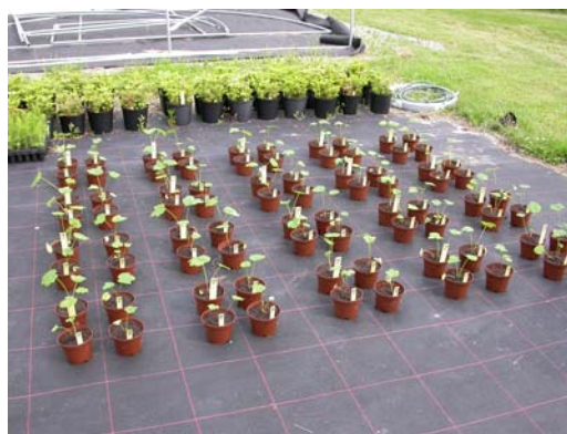
Figur 8. Pottene er klar for sprøyting. Foto: 21.06.2005.