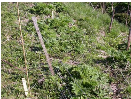
Figur 12. Fra sprøytefeltet på vestsiden av Vollebekken på UMB dagen før sprøytingen. Foto: 03.05.2007.

For å supplere det ene leddet med mekanisk bekjemping (ledd 6: oppgraving av rotstokker), ble det prøvd slått av stengler/blad ved basis i et separat felt like ved sprøytefeltet, og skjermkutting i et eget felt på østsiden av Vollebekken (figur 13). I alle feltene ble all blomstring begrenset ved å kutte av blomsterknopper etter hvert, for å unngå frøproduksjon og -spredning.