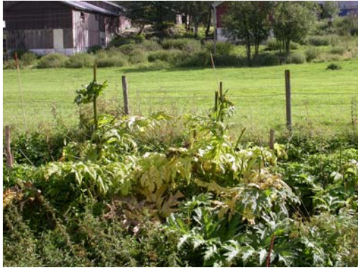
Figur 46. Bestandforsøk på UMB, skjermkutting.180. Foto 06.08.2007.