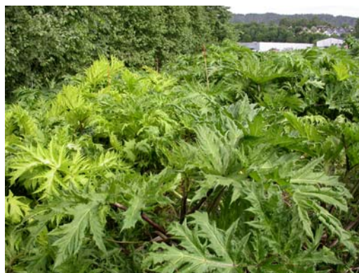
Figur 24. Bestandsforsøk nær Wøyen, ledd 2, Starane 180, store planter, 3 uker etter sprøyting. Foto: 23.06.2005.