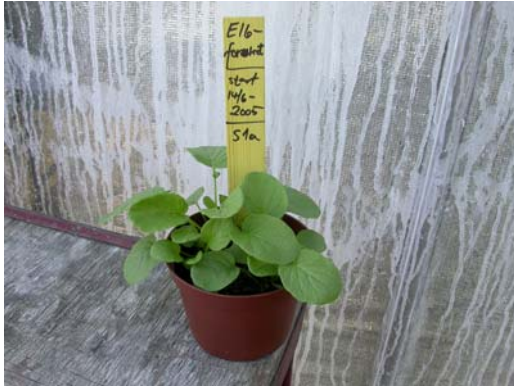
Figur 3. Frøbanktesting. Foto: 08.07.2005.