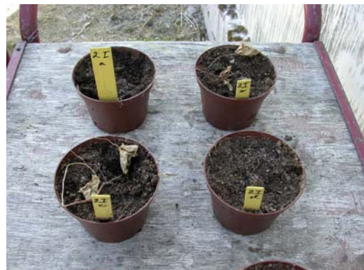
Figur 19. Potteforsøk, ledd 2 / Starane 180, 3 uker etter sprøyting. Foto: 12.07.2005.