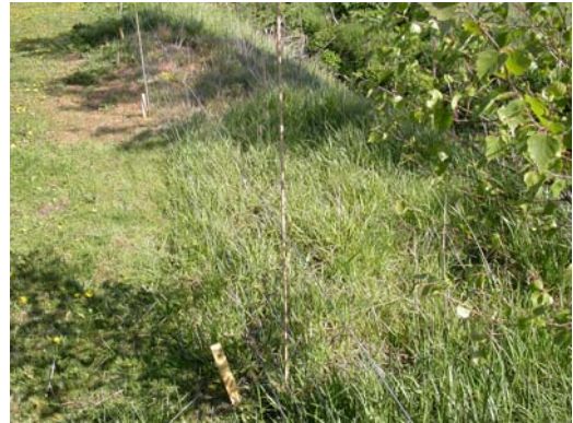
Figur 43. Bestandsforsøk på UMB, ledd 4, Harmony Plus 50T, rute 406/4. Foto 23.05.2007.