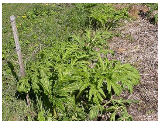
Figur 39. Bestandforsøk på UMB, ledd 2, Starane 180, rute 205/2. Foto 23.05.2007.