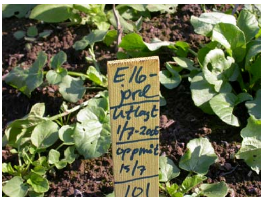
Figur 14. Vinterkarse dominerte blant de fremvokste planteartene. Foto: 06.09.2005.

Det ble i alt registrert 38 framvokste plantearter/-slekter. Vinterkarse dekket gjennomsnittlig 30% av arealet (figur 14), meldestokk 5%. Små eksemplarer av kjempebjørnekjeks ble funnet i 7 av 21 ruter (figur 15). For å unngå unødvendig spredning av meldestokk, ble store eksemplarer av arten lukt bort høsten 2005.