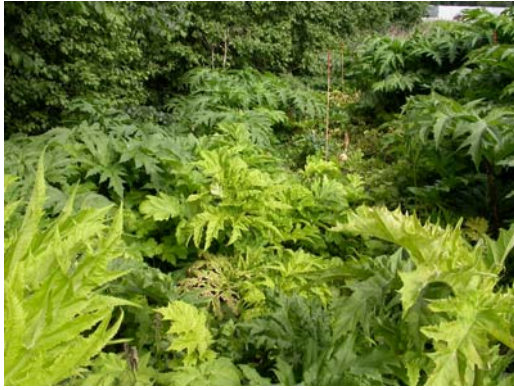
Figur 25. Bestandsforsøk nær Wøyen, ledd 3, Harmony 75 WSB, store planter, 3 uker etter sprøyting. Foto: 23.06.2005.