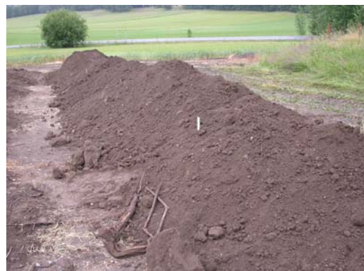
Figur 6. Ranken på Bioforsk Plantehele. Foto: 15.07.2005.