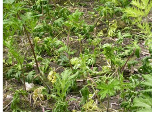
Figur 30. Bestandsforsøk på Drømtorp, ledd 2, Starane 180, rute 103/2, ellers, se figur 29.