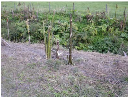
Figur 48. Bestandforsøk på UMB, resultat etter opprydding. Foto 31.08.2007.