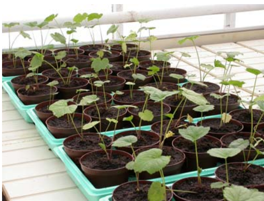
Figur 7. Frøplanter fra Drømtorp ble priklet over i pottar. Foto: 20.06.2005

I mai 2005 ble det forsøkt å spire fram småplanter fra frø som var samlet høsten 2004 i en lokal bestand med kjempebjørnekjeks ved Universitetet for miljø og biovitenskap (UMB). Disse frøene spirte ikke. Derfor ble småplanter med 2-3 varige blad (ca. 10 cm høye; årets frøplanter) hentet fra en bestand i Drømtorp næringspark i Ski kommune. Et utvalg planter med jevnest mulig størrelse, ble priklet over i pottar (figur 7 og 8). Det ble sprøytet 21. juni etter planen gjengitt i tabell 2.