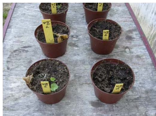
Figur 21. Potteforsøk, ledd 4, Harmony Plus 50T, 3 uker etter sprøyting. Foto: 12.07.2005.