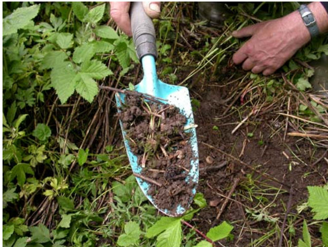
Figur 2. Kjempebjørnekjeksfrø i strøsjiktet. Foto: 01.06.2005.