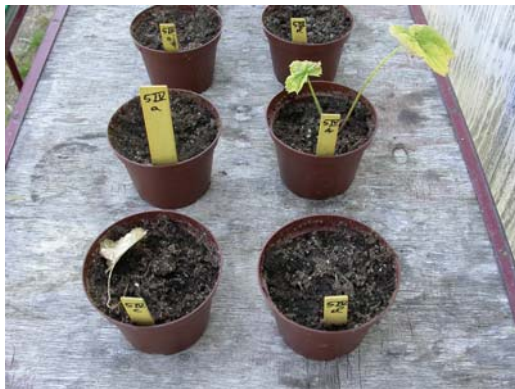
Figur 22. Pottforsøk, ledd 5, Roundup Eco, 3 uker etter sprøyting. Foto: 12.07.2005