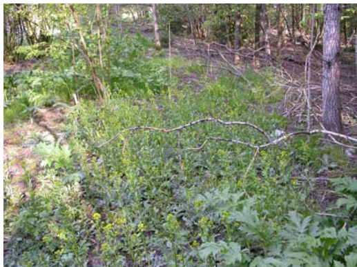
Figur 35. Bestandsforsøk på Drømtorp, ledd 2, Starane 180 -rute 205/2, ett år etter sprøyting. Foto: 11.05.2007

Ledd 6b - Mekanisk med avkutting: Noen småplanter, ca. 40 cm.