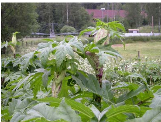
Figur 44. Bestandsforsøk på UMB, ledd 2, Starane 180, rute 205/2, 52 dager etter sprøyting. Foto 25.06.2007.