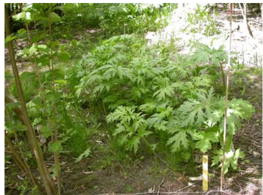
Figur 34. Bestandsforsøk på Drømtorp, ledd 6, avkutting ved bakken, rute 106/6, se ellers figur 29.