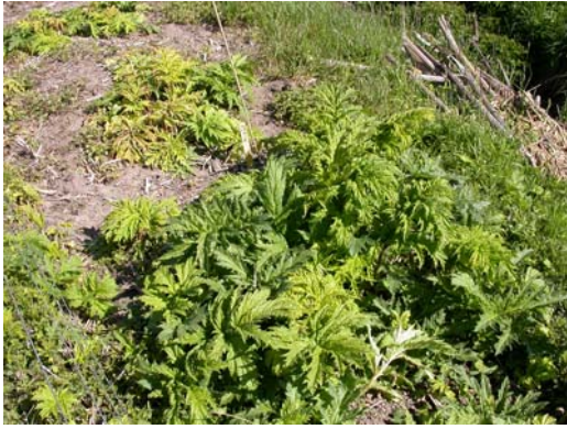
Figur 40. Bestandsforsøk på UMB, ledd 3, Harmony 75 WSB, rute 401/3. Foto 23.05.2007.