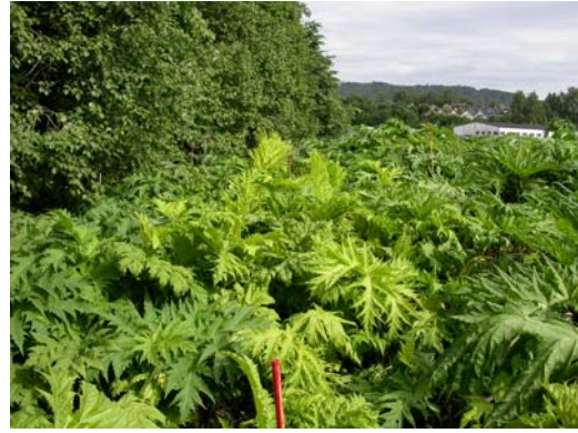
Figur 26. Bestandsforsøk nær Wøyen, ledd 4, Harmony Plus 50T, store planter, 3 uker etter sprøyting. Foto: 23.06.2005.