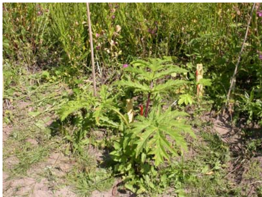
Figur 16. Usprøytet plante. En måned seinere (01.08.2006) var denne planten nedvisnet. Foto: 03.07.2006