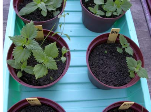
Figur 4. Frøbanktesting. Foto: 08.07.2005.