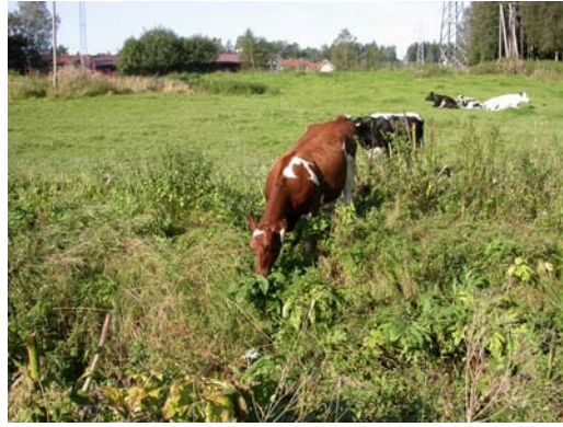
Figur 47. Bestandforsøk på UMB, "biologisk opprydding". Foto 24.08.2007.