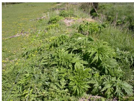
Figur 38. Bestandforsøk på UMB, ledd 1, ubehandlet -rute 303/1, 19 dager etter sprøytedato. Foto 23.05.2007.