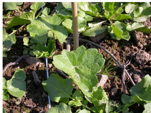
Figur 15. Det kom også noen planter med kjempebjørnekjeks. Foto: 06.09.2005.