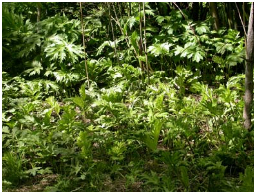
Figur 31. Bestandsforsøk på Drømtorp, ledd 3, Harmony 75 WSB, rute 102/3, se ellers figur 29.