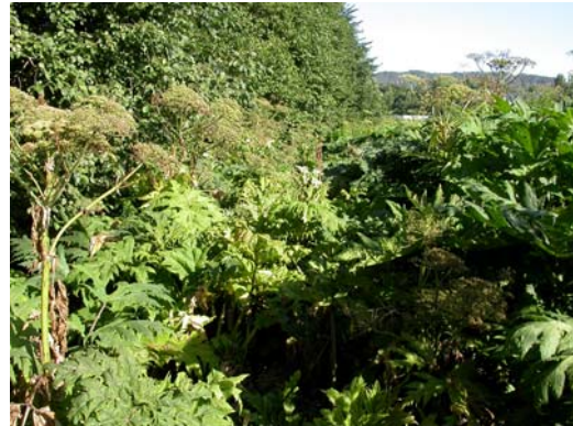
Figur 28. Bestandsforsøk nær Wøyen, ledd 4, Harmony Plus 50T, store planter, nesten 11 uker etter sprøyting. Foto: 16.08.2005.