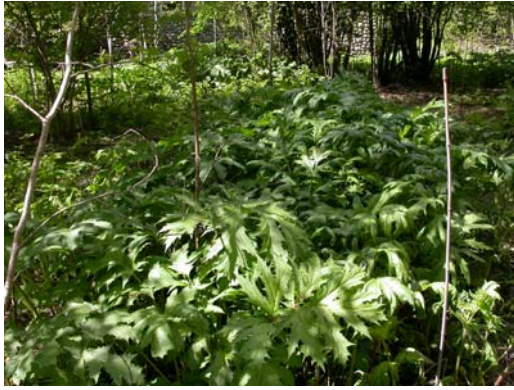
Figur 29. Bestandsforsøk på Drømtorp, ledd 1, ubehandlet, rute 204/1, 24 dager etter sprøyte-dato. Foto: 01.06.2006.