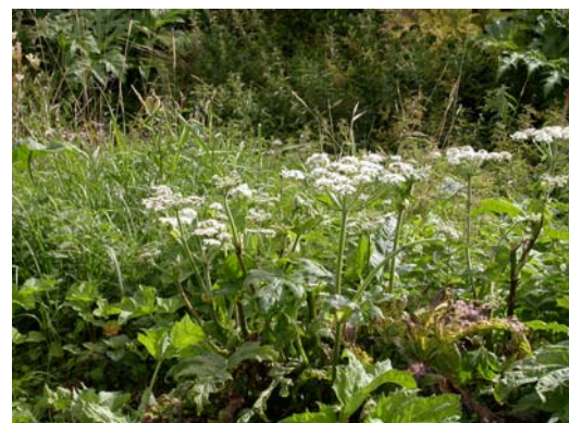
Figur 45. Bestandsforsøk på UMB, ledd 3, Harmony 75 WSB, rute 401/3, 89 dager etter sprøyting. Foto 01.08.2007.