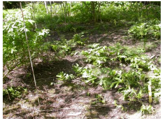
Figur 32. Bestandsforsøk på Drømtorp, ledd 4, Harmony Plus 50T, rute 201/4, se ellers figur 29.