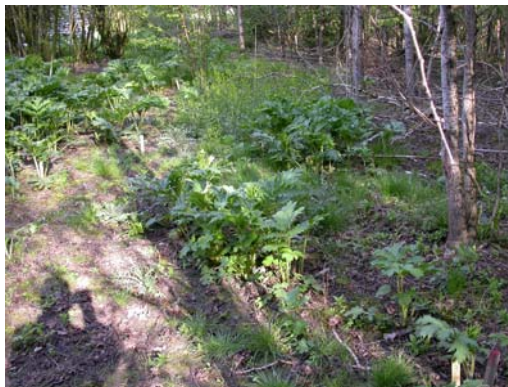
Figur 36. Bestandsforsøk på Drømtorp, t.v.: ledd 5, Roundup Eco - rute 305/5, og t.h.: ledd 4, Harmony Plus 50T, ett år etter sprøyting. Foto: 11.05.2007.

Befaring 3. juni, 8 dager etter at hele feltet ble kuttet ned 25. mai: