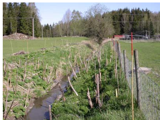
Figur 13. Slåttefeltet t.v., med sprøytefeltet bakenfor. Skjermkuttingsfeltet t.h. Vollebekken i midten i retning nordover mot Årungen. Foto: 03.05.2007.