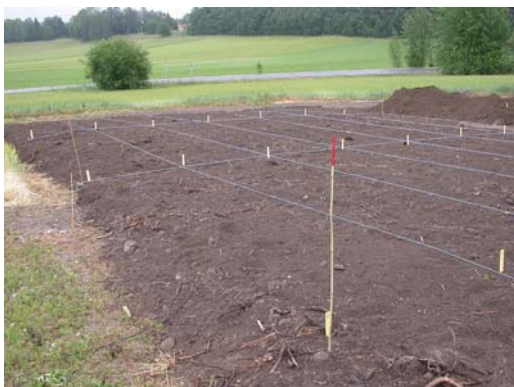
Figur 5. Jord fra Wøyen utlagt i ruteforsøk på forsøksarealet til Bioforsk Plantehele på Ås. Foto: 15.07.2005.

Den opprinnelige planen i dette forsøket var å teste bruk av umoden kompost for å redusere mengden spiredyktige frø i jordmassene. Fordi det spirte opp så lite kjempebjørnekjeks fra massene som var lagt utover, ble målsettingen endret i samråd med oppdragsgiver. Fremvokst kjempebjørnekjeks i rutene ble fulgt opp enkeltvis. Samtidig åpnet vi deler ranken etter hhv ett og to år, for å se på fremspiring av kjempebjørnekjeks fra mellomlagret jord.