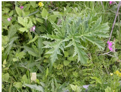
Figur 17. Samme plante som i figur 16, ett år seinere, i sterk konkurranse med andre arter. Foto 23.05.2007.