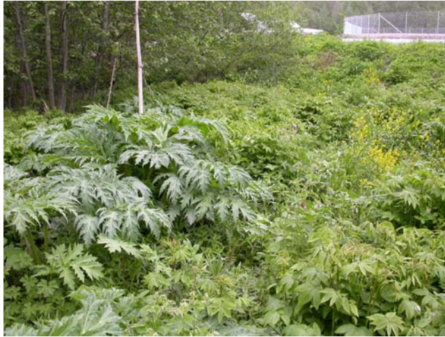
Figur 1. Kjempebjørnekjeks i skogholt nær Wøyen. Foto: 01.06.2005.