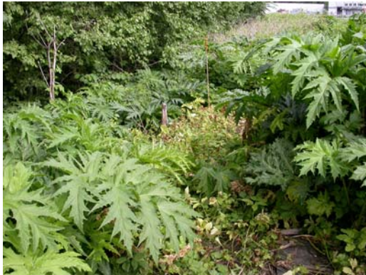
Figur 27. Bestandsforsøk nær Wøyen, ledd 5, Roundup Eco, store planter, 3 uker etter sprøyting. Foto: 23.06.2005.