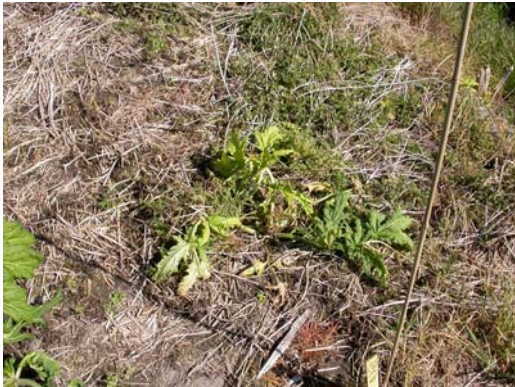
Figur 42. Bestandsforsøk på UMB, ledd 5, Roundup Eco, rute 206/5. Foto 23.05.2007.