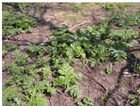
Figur 11 Rosetter av kjempebjørnekjeks på sprøytedatoen. Foto: 08.05.2006.