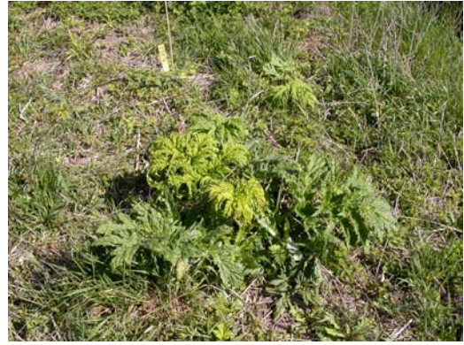
Figur 41. Bestandsforsøk på UMB, ledd 4, Harmony Plus 50T, rute 204/4. Foto 23.05.2007.