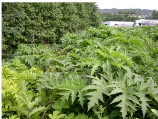
Figur 23. Bestandsforsøk nær Wøyen, ledd 1, ubehandlet, store planter, 3 uker etter sprøytedato. Foto: 23.06.2005.

Blomsterstengler ble kuttet ned for å begrense videre frøspredning. Imidlertid kunne vi ved siste registrering se at det hadde vokst fram nye rosetter fra nedkappede blomsterstengler.