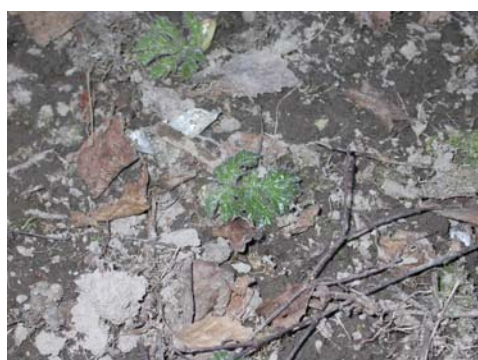
Figur 10. Rosett av kjempebjørnekjeks har så vidt spirt fram fra overvintrende rotstokk. Fra forsøksfeltet på Drømtorp i Ski. Foto: 22.04.2006.

Det ble gjort observasjoner av plantenes utvikling før forsøket startet. 17. april fantes det ingen synlige rosetter. 22. april ble begynnende rosetter tett ved bakken registrert (figur 10). 3. mai var disse 6-10 cm høye. Plante høyden ved sprøyting 8. mai var ca. 15 cm (figur 11). Rutestørrelsen var 5 x 1,5 m 2 .