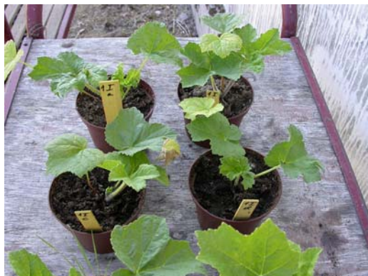
Figur 18. Potteforsøk, usprøytet ledd, 3 uker etter sprøyting. Foto: 12.07.2005.

Starane 180 hadde klart best bekjempende effekt (figur 19), men nesten like god effekt var det av sprøyting med Roundup (figur 22). Noe svakere effekt var det av sprøyting med de to Harmony-preparatene (figur 20 og 21). En viss grasvekst ved de sistnevnte preparatene, kan tyde på at grasfrø har overlevd og vokst frem etter sprøytingen. De få, små kjempebjørnekjeksplantene har også trolig spirt fram etter sprøyting.