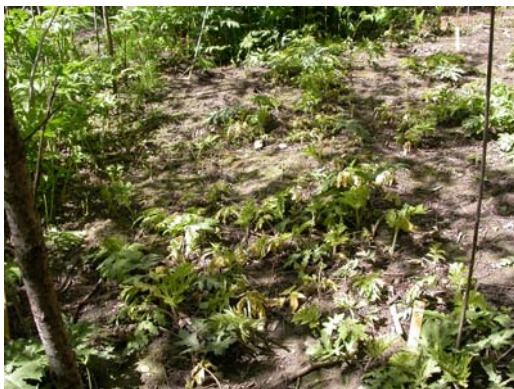
Figur 33. Bestandsforsøk på Drømtorp, ledd 5, Roundup Eco, rute 305/5, se ellers figur 29.