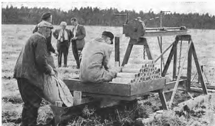
Fig. 5. Myrgrøfteren. Myrgrøfteren spalter myrslaget og rørene føres ned og blir en sammenhengende rørstreng i bunnen av spalten. Bakerst i maskinen kan rørene kontrolleres og forskjellig dekke fylles på. Kutterflis kan f. eks. brukes.

Under prøver på Håamyra ved Levanger i 1953 ble det brukt danske