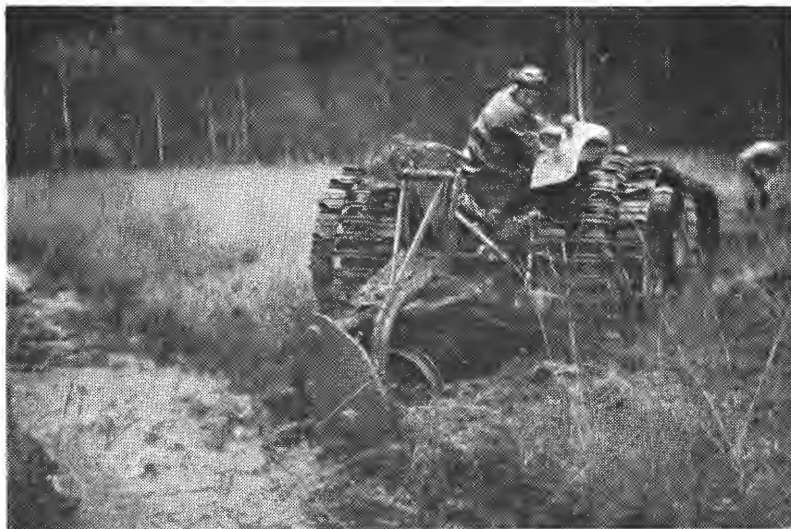
Fig. 6. Sesam grøftefres. Et kastehjul som drives fra traktorens kraftuttak, skjærer løs og kaster ut massen.

De oppgitte vekter og veggykkelser bygger dels på oppgaver fra fabrikkene og dels på måling av rørprøver som Myrselskapet har fått tilsendt. Til Stela-rørene leveres korte bendstykker og T-formede skjøtestykker i forskjellige vinkler for kobling av sidegrøfter til hovedledning.