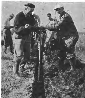
Fig. 3 og 4. Grøfteskruen. Grøfteskruen er også montert til traktorens treppunkt og reguleres hydraulisk idet toppstaget er skiftet ut med en dobbeltvirkende sylinder som hever og senker maskinen. Denne maskin er også særlig lett å manuvrere. Til høyre ser en grøftekroken i bruk.

Maskinen er ikke satt i serieproduksjon, men vil antagelig kunne skaffes på bestilling. Den stiller imidlertid spesielle krav til hastighetsreguleringen for traktoren. Som trekkraft ved grøftingen på Vivang ble benyttet en Farmall traktor D 430, Agriomatic, dvs. en traktortype hvor motoren kan arbeide med fullt turtall ved varierende kjørehastigheter fra null og oppover til vedkommende gear's