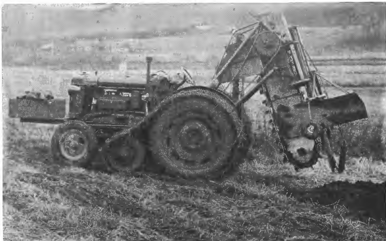
Fig. 2. Nyengets beltegrøftemaskin (skrapekjedemaskin). Maskinen er montert til traktorkroppen og bæres av traktoren. Reguleringen skjer ved hydrauliske sylindre.

Fabrikkeier Petter Nyenget , Levanger, har konstruert en beltegrøftemaskin for traktor (1, 2 og 3). Maskinen som leveres av Nyengets Mek. Verksted, kan tilpasses flere traktortyper. Nyengets grøftemaskin som arbeider etter skrapekjedepriippet, kan brukes både i noenlunde ren myrjord og i steinfri fastmark. Maskinen graver en relativt smal grøft og gravedybden kan — etter ønske — reguleres til 1,3 — 1,4 m dybde.