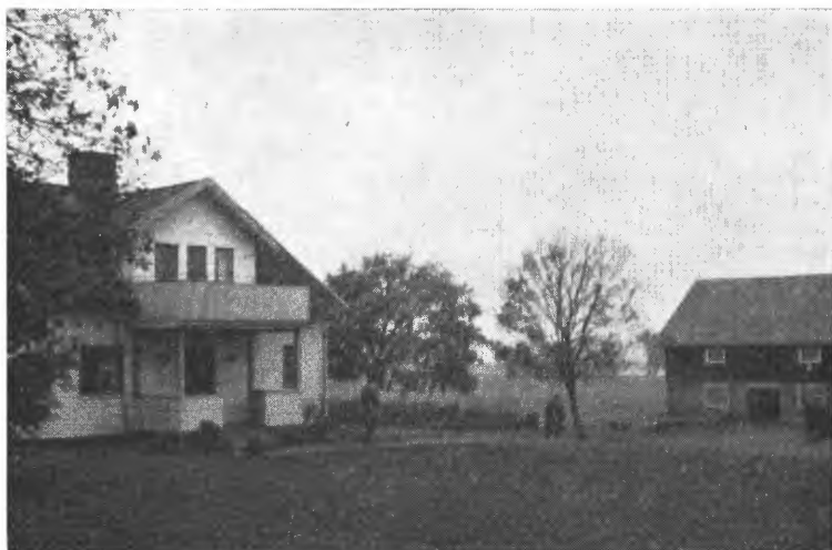
Gårdsbruk i Bältingedistriktet, Uppsala len, hvor myrsynking og jordsvinn vanskeligjør fortsatt jordbruksdrift.

Det var blant deltakerne samstemmighet om at Kungl. lantbruksstyrelsen hadde stor ære av tilretteleggelsen av programmet for ekskursjonene. Disse belyste nemlig på en utmerket måte en rekke av de problemer som Sverige har i forbindelse med strukturendringen som for tiden pågår innen det svenske landbruk. Et enkelt eksempel fra dagens debatt vil belyse dette. Sverige har i dag rundt regnet 200.000 jordbruk hvorav ca. 100.000 småbruk ikke anses for levedyktige, og som er dømt til å forsvinne i den nærmeste 10 — 15 års periode. Halvparten av eierne på de «dødsdømte» brukene er over 55 år, og må antas å ha store vanskeligheter med omskolering for andre yrker. Svenskene går følgelig sterkt inn for å finne løsninger på problemene, og de viker heller ikke tilbake for radikale tiltak for å løse dem.