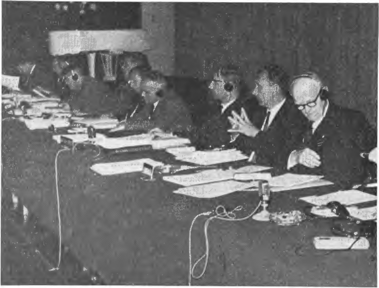
Glimt fra møtesalen i Hotel Foresta under Stockholmskonferansen.