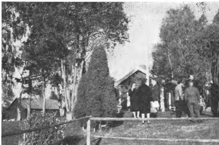
Gårdsbruk ved Europaveg 18 i Västmanland len, som blir sterkt beskåret av den nye vegtraséen.