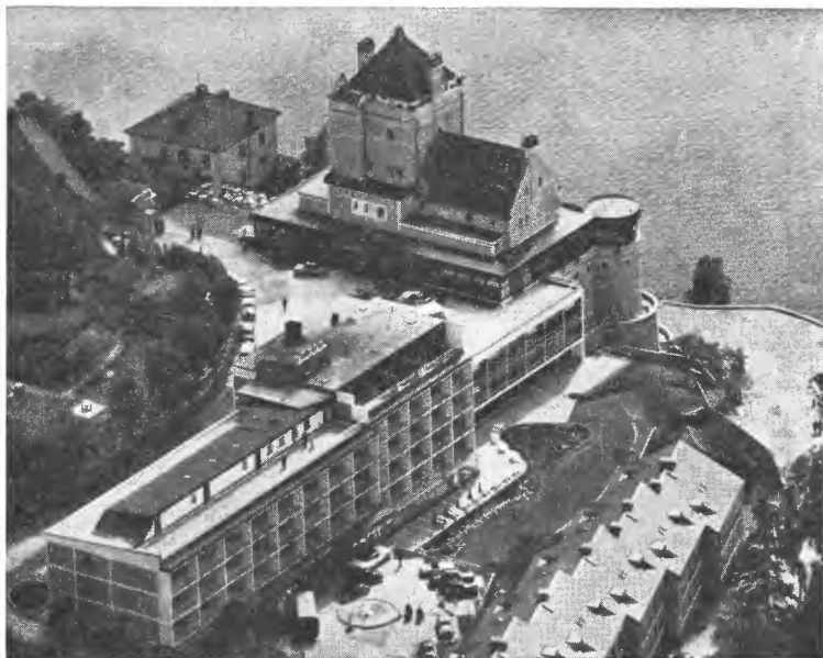
Hotel Foresta, Lidingö, hvor Stockholmskonferansen ble holdt.