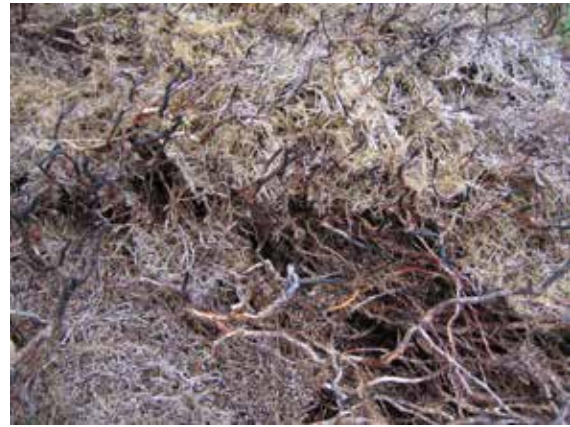
Foto 2. Store mengder mose og strø i gammal lynghei er ofte vanskeleg å fjerne ved sviing, og gjere at frøspirar bruker lengre tid på å vekse fram etter sviing.

Kystlyngheier som ikkje er i hevd, er heller ikkje gode beiteområder. Røsslyngen vert gammal og grov, og urter og gras går ut. Gjengroingsartar som einer, rogn, vier og bjørk kjem inn. Gammal lynghei har ofte eit tjukkare lag av mose og strø i botnen av vegetasjonsdekket, som kan vere vanskeleg å fjerne ved sviing. Dette laget kan gjere at frøspirar treng lengre tid på å vekse fram. I tillegg er det vist at gamle røsslyngplanter i mindre grad set rotskot. Når den konkurransesterke røsslyngen bruker lang tid på å vekse fram, gir dette tid og rom til at uønska og problemfylte artar kan etablere seg. Mangelfull skjøtsel kan også gjere at enkeltartar går ut, både frå vegetasjonssammansetninga og i frå frøbanken. Det er også vist at den grove strukturen i gammal lynghei kan gi ein eld som er vanskelegare å kontrollere enn det ein har ved sviing av velskjøtta lynghei. Gammal lyng er dessutan meir utsett for vintertørke, slik som det ein erfarte vinteren