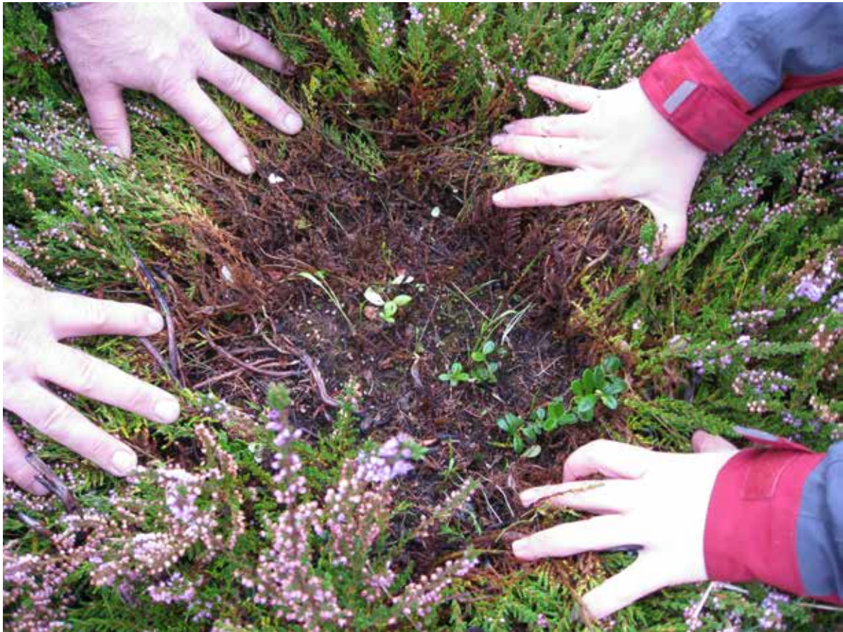
Foto 3. I velskjøtta lynghei står oftast lyngplantene tett, og det er lite mattedannande mose og strø under lyngen.

2014. Lyngheia blir då lett antennbar og utgjer ein stor risiko for ukontrollerte skog- og lyngbrannar.