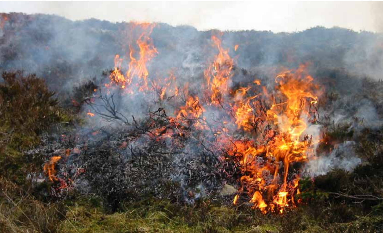
Foto 1. Lyngsviing er saman med beiting ein del av den tradisjonelle lyngheiskjøtselen. Målet med sviinga er å fjerne gammel vegetasjon til fordel for ny og meir næringsrik vegetasjon.