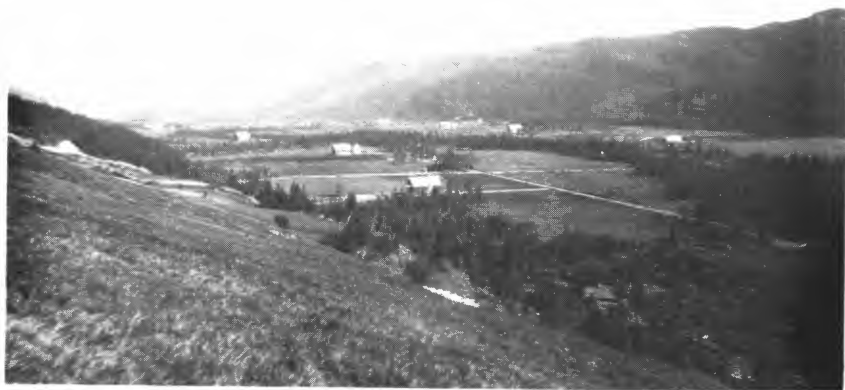
Fra feltet Aursjømyr i Rissa og Verran. Feltet innkjøpt i 1923. «Ny Jord» 1926.

2 460 000,- til forberedende arbeider på sine felter, i alt 233 stykker. Innkjøp av feltene ble i regelen finansiert gjennom rentefrie lån fra statens side.