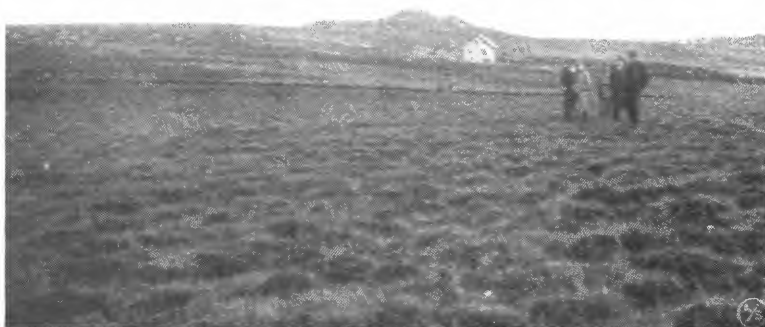
Skjæret i Time. Feltet innkjøpt i 1922. «Ny Jord» 1922.

mellomlekk. Landbruksdepartementet fylgde stort sett direktøren, men sa at det var ein føresetnad at selskapet innskrenka seg til større tiltak som ville overstige evna til lokale selskap. Alle mindre bureisningsarbeid burde landbruksselskapa og andre lokale dyrkingslag ta seg av.»