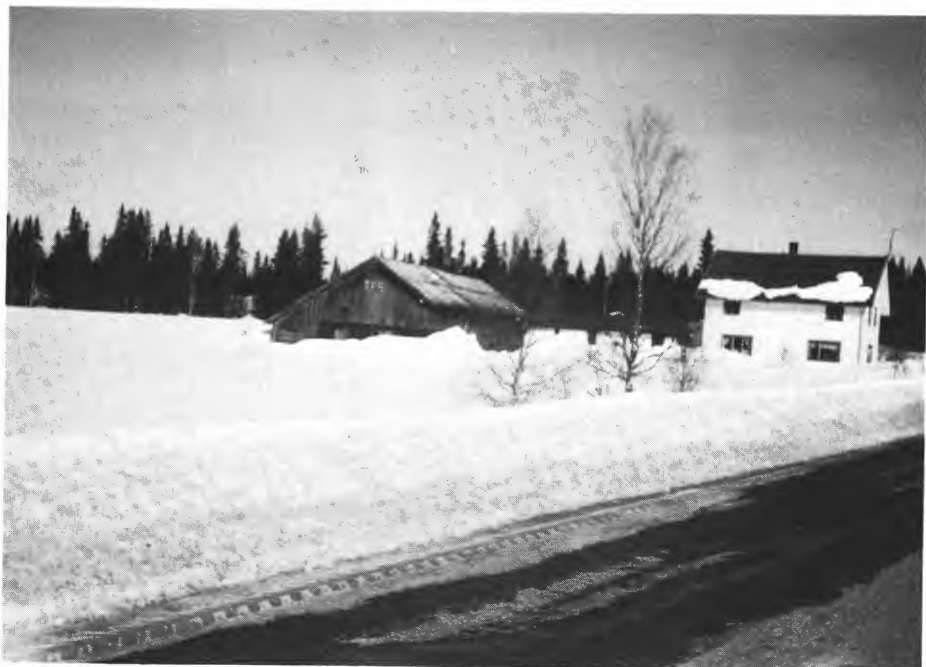
Første bureisingsbruket i Trysil, opprettet 1916 og bygd 1920–23. Areal: 60 dekar, hvorav 40 dekar er fulldyrket. Bildet viser husa som ble bygd første gangen av Magnus og Borghild Lillemo.