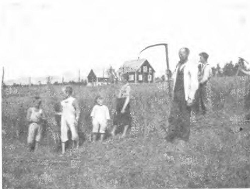
Bureisingsbruk på Øverland (Furlandsmyrene) i Vestnes. Feltet innkjøpt i 1922. «Ny Jord» 1924.