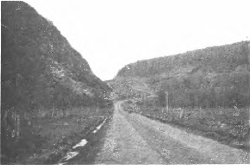
Veganlegg på Kjølstad i Malangen. Feltet innkjøpt i 1929. «Ny Jord» 1935.

den tid slik vi i dag kjenner dem. Forholdet var jo også ofte det at en ikke fikk tid til å foreta nærmere undersøkelser sett på bakgrunn av det tidspress en hadde som følge av de mange som gjerne ville ta fatt snarest mulig. Imidlertid er det på det rene at visse og mer praktiske undersøkelser også ble utført på denne tiden, f.eks. ved studium av naturlige jordprofiler, studier av jordprøver uttatt ved jordbor o.l., ved siden av det totalinntrykk en dannet seg på grunnlag av vegetasjon m.v. En fikk på dette viset et ganske godt kjennskap til jordsmonn og grunnforhold, selv om det var åpenbart at undersøkelser av denne art led av visse feil og mangler. Spesielt når forholdene med hensyn til jordsmonn og grunnforhold varierte meget.