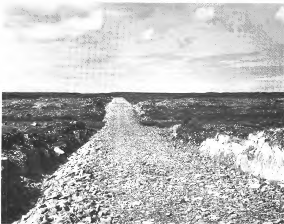
Veganlegg til feltene på Smøla. Første felt Frostad, innkjøpt i 1928. «Ny Jord» 1931.

Selv om det i statens regelverk ikke uttrykkelig er sagt at bureisingsbruket bør være så stort at det kan gi levevei for en familie, så har nok dette trolig vært meningen. For såvidt kan det sies at målsettingen var den samme for den bureising som Selskapet Ny Jord tok initiativet til, og den som staten senere støttet ved bidrag, lån, garantiansvar og rentefritak for lån.