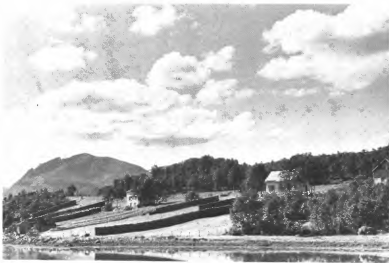
Fra bureisingsbruket Kjølstad i Malangen. Fellet innkjøpt i 1929.

6. «Kolonisten faar laan til erhvervelse og bebyggelse av bruket, rente- og avdragsfri i 5 aar. I særskilte tilfælde kan rente- og avdragsfriheten forlænges med indtil 2 aar. Laanet forrentes og amortiseres derefter, efter samme rentefot og med samme amortisations-tid som brukslaanene i Den norske stats smaabruk og boligbank.»