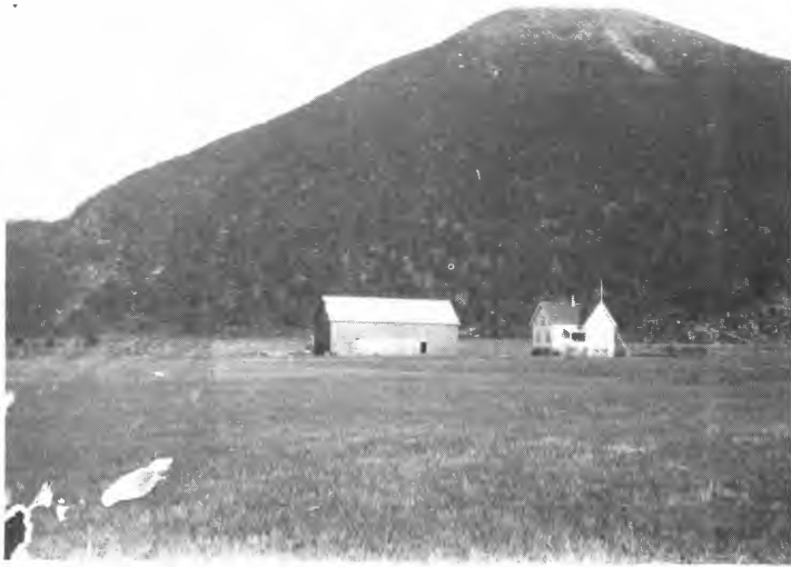
Bureisingsbruk på Farstad, Hustad. Et av de første Ny Jord-feltene i Møre og Romsdal.

vekst og utvikling. Under verdenskrigen 1914–1918 fikk vi tilfulle føle hvor sårbart vårt land var på grunn av vårt store importbehov. Til tross for landets nytteverdi ble vår viktigste transportvei, den sjøgående, sterkt hemmet av de stridende parter, slik at forsyninger uteble. Resultatet ble knapphet og kriser på høyviktige matvarer, selv med en strengt gjennomført rasjonering. Allerede under krigen ble det derfor iverksatt tiltak for å sikre den innenlandske matvareproduksjon. Jeg minner her om tvangsdyrkingen i 1918. Med dette som bakgrunn var det naturlig at en allerede tidlig i mellomkrigsårene søkte å utbygge alle tiltak som tok sikte på å øke vårt forsyningspotensial innen landets grenser. Nydyrkingen ble her et nøkkelord, ikke bare på eldre bruk, men også på nye som burde opprettes. Bureisingen fikk på dette vis et ekstra puff. Dermed kunne det også sikres