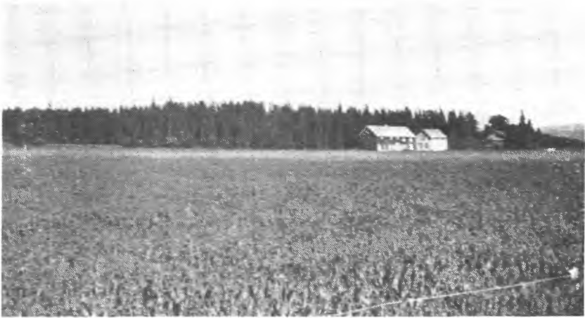
Bureisingsbruk på Tramyr i Overhalla. Feltet innkjøpt i 1927. «Ny Jord» 1940.

det gått ytterligere ned. Dette gir dog ikke noe fullstendig bilde av stillingen. Verre enn nedgangen i antall bruk som er tilstått bureisingstilskott, er det at byggingen på brukene praktisk talt stoppet helt opp.