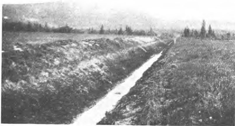
Kanaliseringsarbeid på Tramyr i Overhalla. Feltet innkjøpt i 1927. «Ny Jord» 1930.