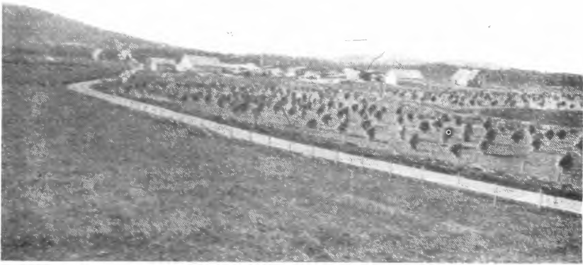
Fra Lautmoen i Åsnes. Feltet innkjøpt i 1922. «Ny Jord» 1925.