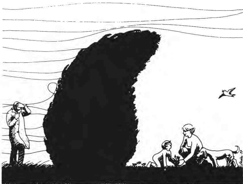
Fig. 3. Leplantning øker trivselen.

Forsidetegningen til det tidligere omtalte årsskrift (S.F.F.L. 1986) illustrerer dette på en utmerket måte (fig. 3).