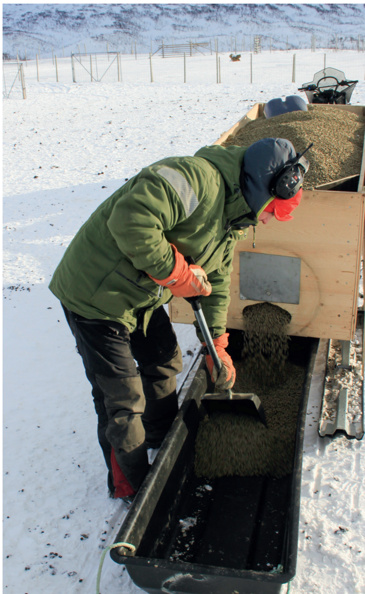
Go biebma fápmo-fuođđariiguin, de ávžžu- huvvo atnit fuođđariid mat leat heivehuvvon bohccuide, nu movt Reinför bas. Buot Norgga fápmofuodarlágideaddjit lágidit fuođđariid mat leat heivehuvvon bohccuide.

Bohcco luondu lea roggat, ja jus it ane fuođargári, de sáhtta stuora oassi fuođđaris mannat duššái go seahkánit muohttagii eai ge leat šat olámuttus bohccuide, dahje go billohuvvet go dulvet dahje njusket. Olu boazodoallit atnet stuora plastihkka fuođargáriid maida leat bijahan áissáid vai sáhttet skuhteriiguin geasehit.