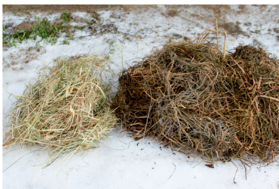
Suinniin gurut bealde govas lea buorre kvalitehta ja dohkkejit bures fuođarin bohccui. Suoinnit olgeš bealde leat njuoskasat ja guhpon, ii ge daiguin ábut biebmam bohcco. Iešguđetlágan rásiit ja šattut giettis váikkuhit suinniid máhkui.

Fápmofuođar lea gordne- ja soija-pellets masa leat lasihuvvon minerálat heivehuvvon bohcco biebmobárbui. Dábálaččat láve veaháš ádjánit ovdal go boazu hárbána fápmofuođđara máhkui ja borragoahdá dan bures. Fápmofuođđaris lea unnán struktuvra, ja