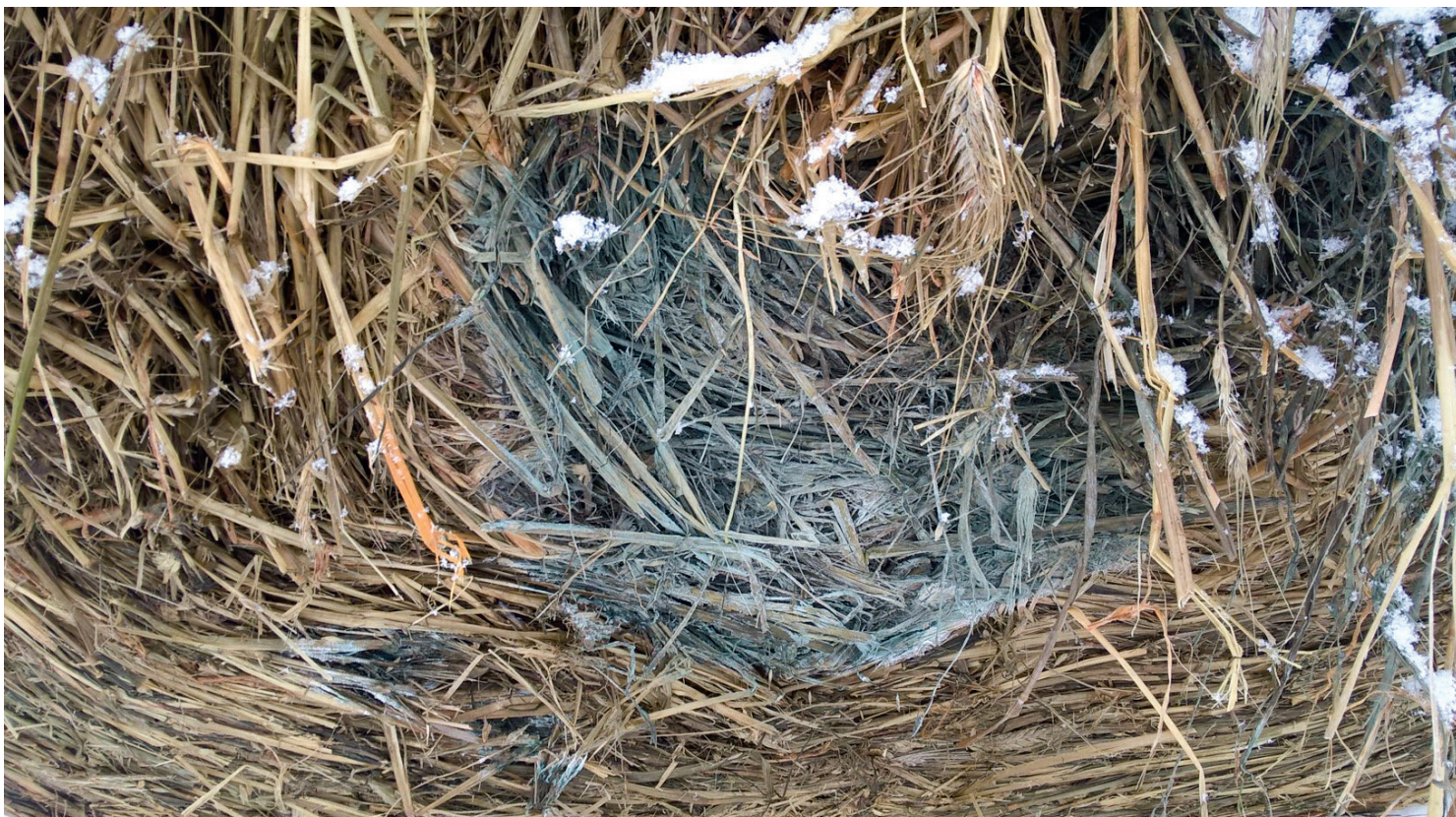
Il galgga biebmátt bohccuid suoidnespáppaiguin mat leat guhppon.