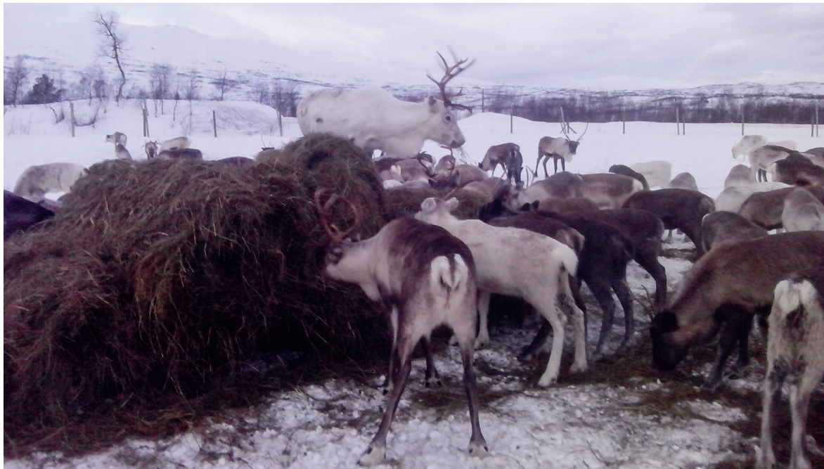
Bohccot mat borret roavafuođđara suoidnespáppain. Bohccuid berre biebmagoahtit ovdal go nealgugohtet, sihkkarastin dihte ahte boazu atná ávkki odđa fuođdaris. Čuovo dárkilit mielde mo guohtundilálašvuodat leat!!