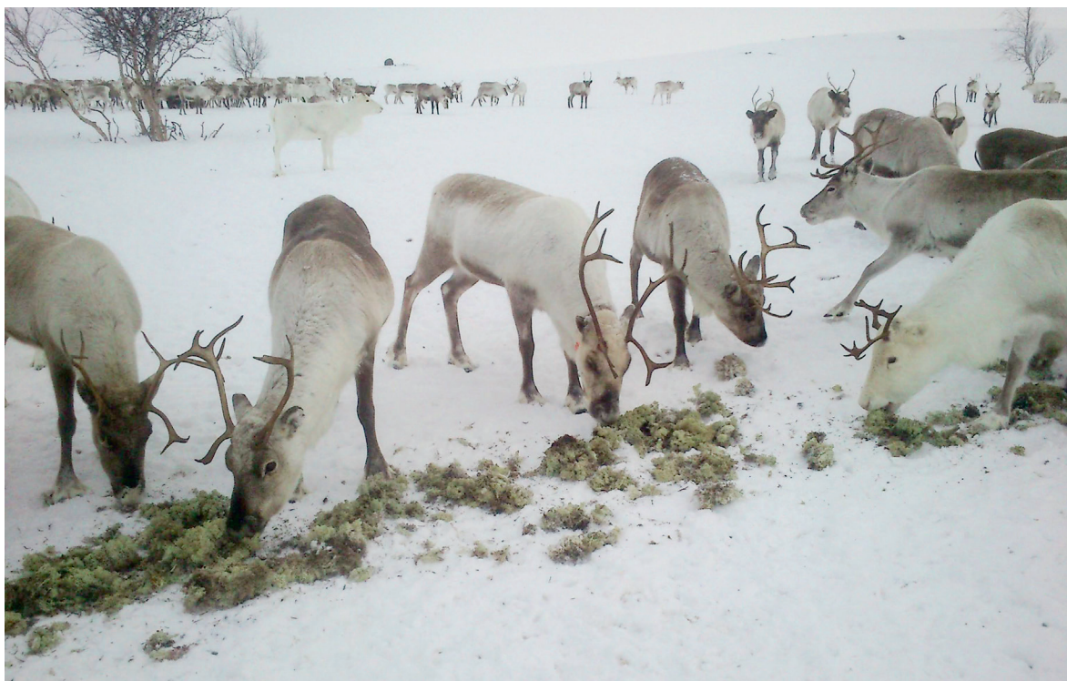
Go lonuha fuođđara, dahje go guohtumis sirdá fuođđariidda, de dárbbáša boazu áiggi hárrjánit máhkui. Jus dus leat jeahkálat olámuttus, de sáhtát seaguhit liigefuođđara jeahkáliidda vai boazu jođáneappot borragoahtá fuođđara. De boazu borrá jeahkála mas lea liigefuođđara máhku.

Dat lea danne go boazu lunddolaččat ohcá biepmu eatnamis, ja nu dat álgá «čuoggut», ja loahpas borragoahtá biepmu.