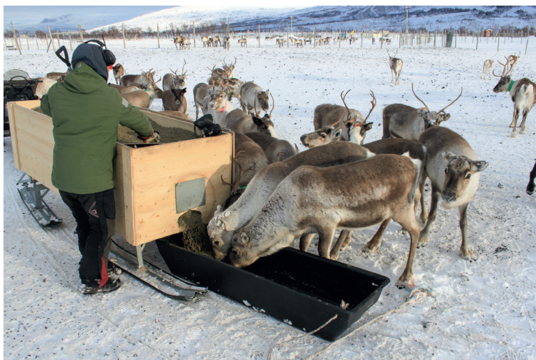
Olu boazodolliin leat iešguđetlágan vásáhusat biebmaniin. Muhto, buot boazodoallit geat bibmet seamma guovllus guhkit áiggi – sihke muohtan ja bievlan – ávžžuhit atnit fuođđári – maddái obbasis ja go bibmet fápmofuođđariiguin dahje rásse-pelletsain.

guhkimusas eret biebmanajis. Ja go nu dahket, de eai guođo dábálaš guohtuneatnamiin ge, ja biebman dagaha eanet nealggá geahnohis bohccuide. Jus biepmat beare unnán, de lea várra ahte stuora, gievrras bohccot ožžot buoret vuoimmi, seammás go unnimus bohccot nelgot jámas. Muhtin boazodoallit addet lagabui guokte kilo fápmofuođđara beaivválaččat juohke bohcco nammii ealus, sihkarastin dihte ahte buot bohccot ožžot borrat. Earát ges oaivildit ahte 0,75 kg beaivái lea doarvái jus kombinere suinniiguin/suoidnespáppain, dahje jus guhtot vel dasa lassin.