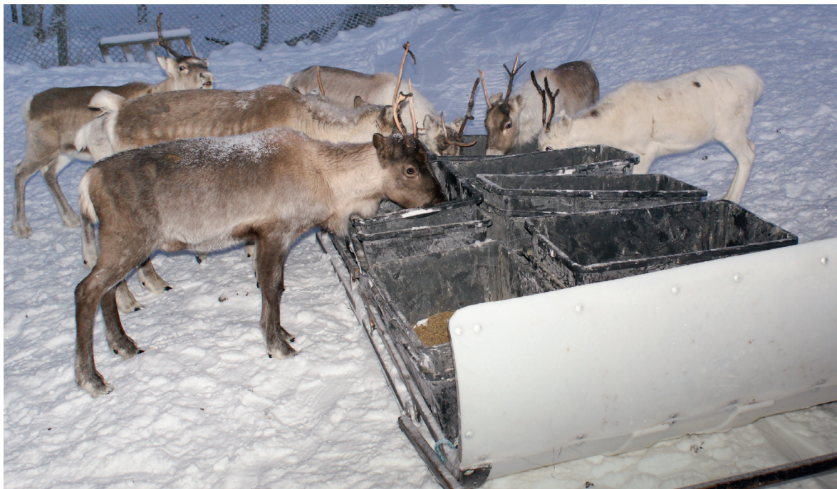
Reahka mainna fievrrida fuođđariid.