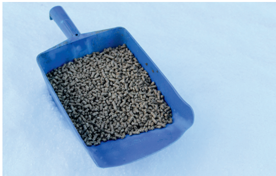
Fápmofuođđarat (govas) ja rásse-pelletsat sistsidollet sullii 90 proseantta goikeávnnessa. Dainna lágiin fievrrida unnán čázi biebmabáikái.

Liigefuođđara goikeávnnessidoallu lea dehálaš go galggat válljet iešguđetlágan fuođarsorttaid gaskkas. Goikeávnnessa lea dat oassi fuođđaris mii ii leat čáhci ja mas bohccot galget suolbmudanoliin oažžut biepmu. Njuoska fuođđara, mas lea vuollegis goikeávnnessa, lea divrras fievrridit ja dat jiekŋu álkit.