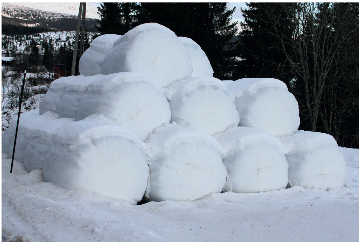
Suoidnespáppain ferte leat buorre kvalitehta vai boazu sáhtta dain ávkki atnit liigebiebmun. Suoidnespáppat mat sisttisdollet unnit go 25 proseantta goikeávdnasa jikŋot garra spábban buolašin. Govven: Svein Morten Eilertsen, NIBIO

Buvttadeaddjit ávžžuhuvvojit garrasit atnit ensilerenávdnasiid suoidnespáppain sihkkarastin dihte ahte gevvat riehta ja váras váldin dihte energiija, earret eará sohkkara mii suddá čázis. Iskkadeamit čájehit ahte bohccot leat váibmileappot suoidnespáppaide maida leat lasihuvvon ensilerenávdnasa.