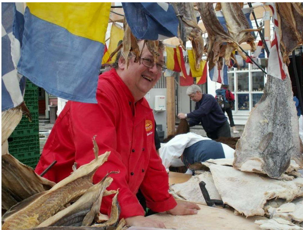
Representant frå Stocca fisso

Det er mange utstillarar som kjem att år etter år. Det tyder på at arrangementet vert verdsett av utstillarane. Av dei 32 stillarane som svarte, var seks med for første gang, resten hadde vore med før. Heile 13 av dei spurde, hadde vore med fem eller fleire gonger.