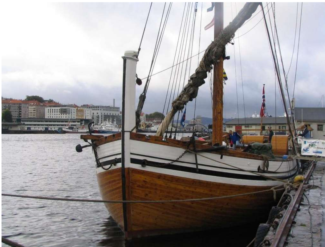
Brødreskuta tok turen frå Lofoten med tørrfisk

I kapitel 2 og 3 presenterar vi skjematisk svara frå publikums- og utstillarundersøkinga. Vi listar spørsmålå med fordeling på svaralternativ. Under ein del av svara er det gitt ein kort kommentar. Ei vidare analyse av resultatata der ein ser på koplingar mellom fleire svar kjem i kapitel 4. Der vil nokre av svara også samanliknast med undersøkinga «Bønder i byd'n –Bergen matfestival 2006». I kapitel 5 kjem ei kort oppsummering av viktige funn i forhold til problemstillingane.