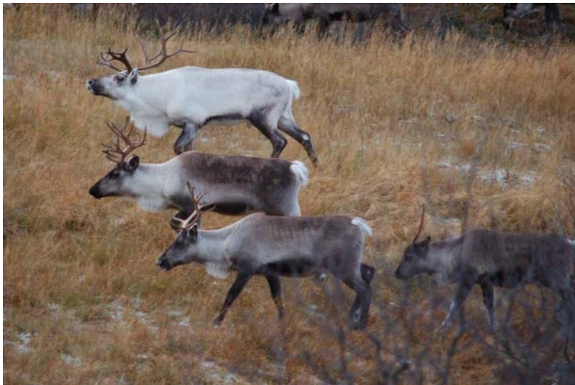
Rein i drift.