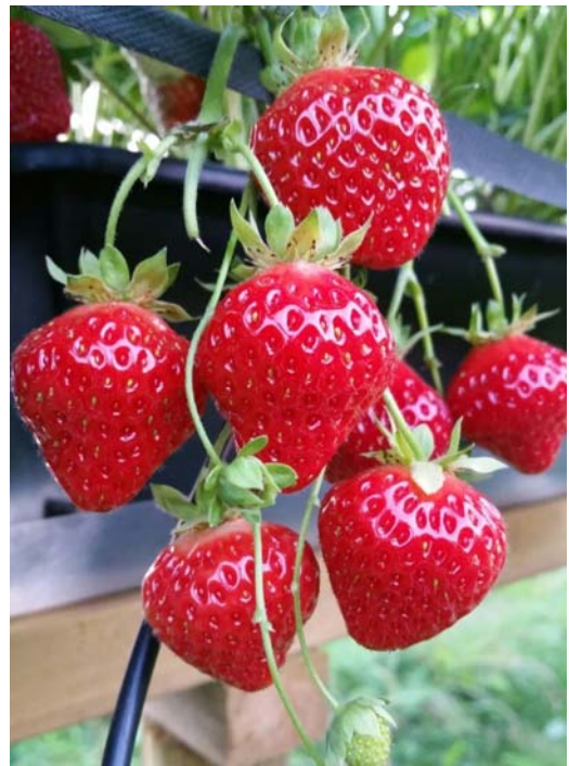
Kvalitetsproduksjon av jordbær.

Krüger et al. 2012 (Dyrking av tre sorter ved fem lokaliteter i Europa): Jordbær ble dyrket fem steder i Europa hvor de nordligste lå i Stjørdal og København og de sørligste i Sveits og Italia. Vekst og utvikling, avlinger og kvalitet ble undersøkt. Denne undersøkelsen representerer ikke det vi har definert som arktiske vekstforhold, men viser likevel interessante trender. Bærene fra de nordligste dyrkingsstedene hadde høyest tørrstoffinnhold og størst innhold av organiske syrer. Bær dyrket lengst sør var rødere enn i nord, trolig på grunn av høyere innhold av fargestoffer (anthocyaniner).