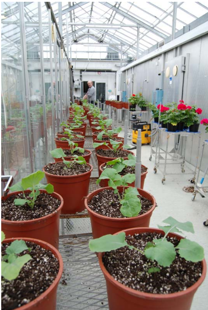
Klargjøring til forsøk i klimalaboratorium (UiTø).

Lignende undersøkelser kan og bør gjennomføres under naturlige klimaforhold utendørs, men også da med mest mulig kontroll og overvåking av vekstbetingelsene. Et eksempel her er såkalte 'semi-feltforsøk' der en bruker samme sort, jord og gjødsling, og gjennomfører forsøkene i store pottes på steder med ulikt klima for å fange opp virkningen. Men selv da vil naturlig variasjon i ulike vekstfaktorer (temperatur, lys, fuktighet, osv.) gjøre det vanskelig å avgjøre nøyaktig som påvirker resultatene mest. Generelt kan en kanskje si at jo mindre kontrollert forsøket er, jo flere ganger må det gjentas før konklusjoner kan trekkes. Det er ikke helt uvanlig at to forsøk kan gi motstridende resultater.