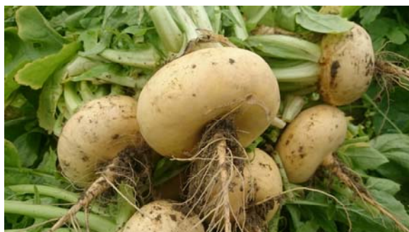
Målselvnepe og Gullauge (Gulløye) - tradisjonsrike vekster i Nord-Norge.

Halland et al. 2016 (Northern Cereals – prosjektrapport): Det finnes nordlig sortsmateriale av bygg, en kornart med tusenårig historie til både mat og fôr. I Nord-Norge var det gamle landsorter som dominerte i tidligere tider, for eksempel 'Dønnesbygg' og 'Bjarkøybygg'. Disse ga modent bygg tidligere enn dagens sorter, men ble likevel byttet til fordel for mer moderne sorter med større avlinger og bedre egenskaper utover 1900-tallet. Eksempler på gamle sorter er 'Fløya' fra Holt i Tromsø og 'Nordlys' fra Vågønes i Bodø. Fra 1980-tallet avtok arbeidet med sortsutvikling samtidig med at korndyrkingen i Nord-Norge gikk sterkt tilbake. I dag har imidlertid interessen for disse gamle sortene tatt seg opp igjen, spesielt i forbindelse med maltproduksjon til ølbrygging.