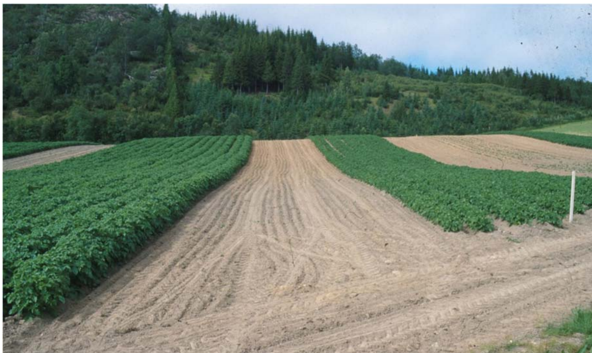
Settepotetproduksjon i Nord-Norge.

Planter dyrket ved de laveste temperaturene hadde 2-3 uker kortere dvaleperiode enn ved de høyeste temperaturene (målt ved 18 °C fra høsting). Daglengden under dyrking så ikke ut til å virke inn på varigheten av dvalen. Lav temperatur (4 °C) i en måned etter høsting, og deretter 18 °C, så også ut til å redusere dvaleperioden med 2-3 uker hos knoller dyrket ved de høyeste temperaturene. Forsøkene viste også at både spireevne og antall groer etter lagring ble påvirket av dyrkingsforholdene året før.