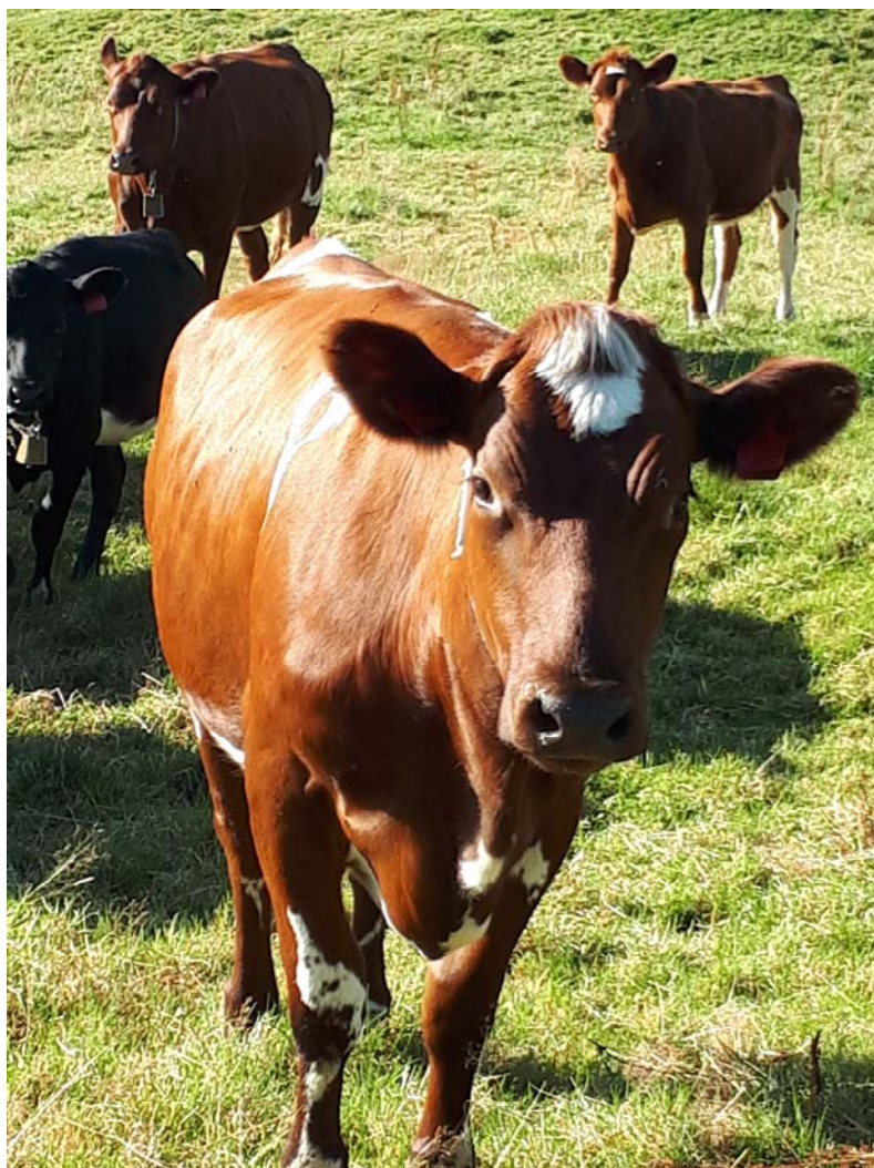
Fotogene storfe på beite.