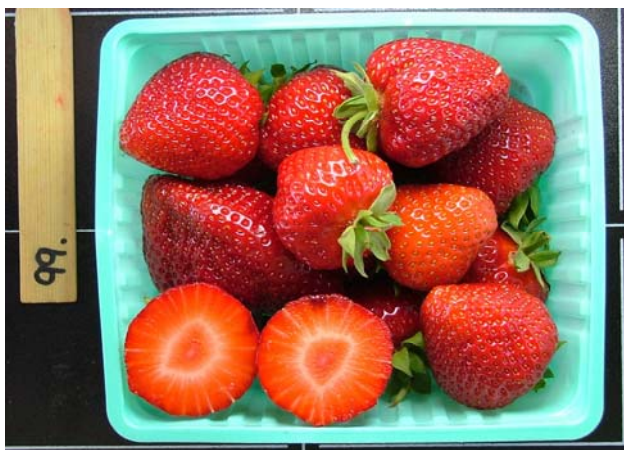
Figur 2. PK00.335 (Polka x Marmolada)

Dette var den mest lovende seleksjonen vi identifiserte i 2005. Prestasjonene synes også å ha holdt seg oppe i 2006. PK00.335 er mer produktiv enn både Korona og Polka. En statistisk sammenligning mellom PK00.335 og Polka over alle feltene, viste at den for salgbar avling ikke var mer produktiv enn Polka. Derimot var den mer produktiv enn Korona. Den har større bær og vesentlig bedre enn Korona og like god som Polka på de subjektive bærvurderingene, inklusive smaken. Muligens litt tidligere enn Korona, men ikke mye. PK00.335 bør prøves mer før eventuell oppformering settes gang. Den er plantet ut i lokalt finansierte forsøk på Kvithamar.