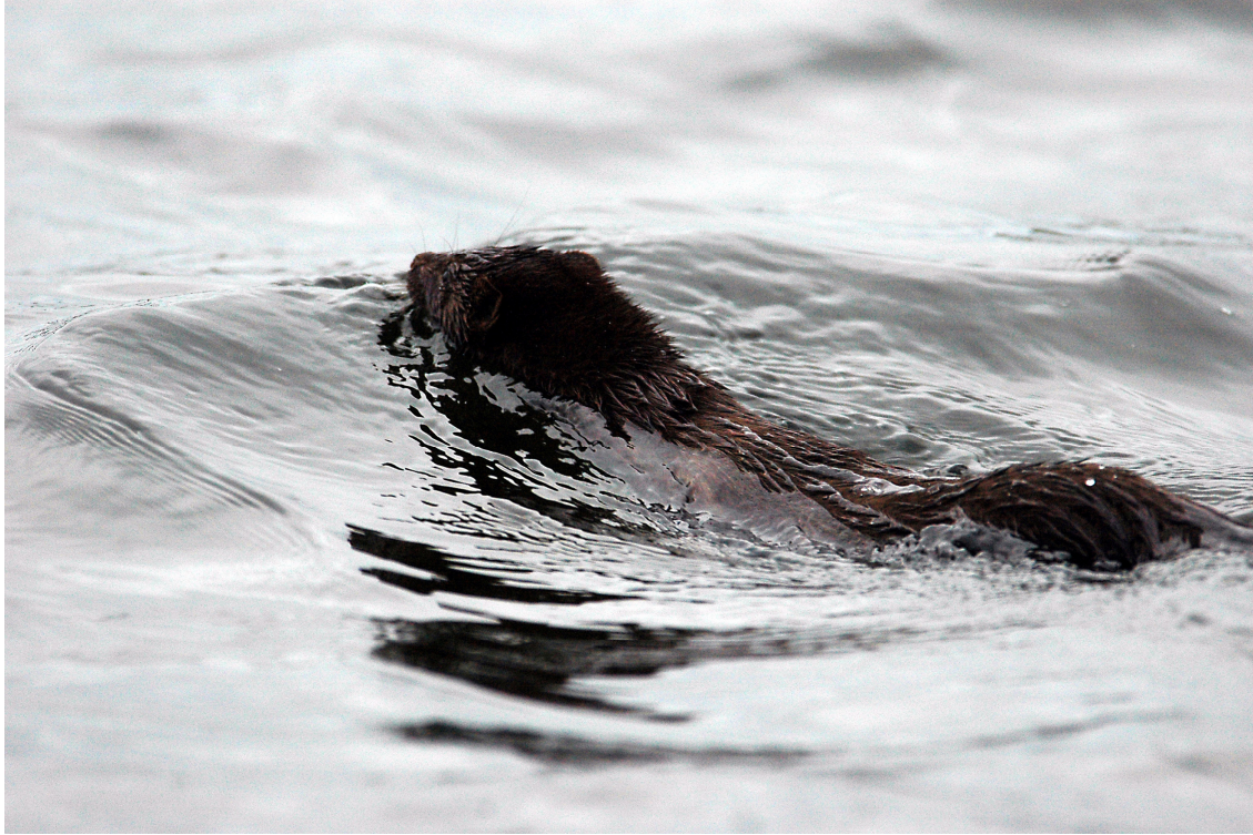
Figur 3. I 2006 er det gjort mange observasjoner av mink, og bestanden synes større enn på mange år.

på høsten er det også sannsynlig at minken vil drepe bisam. Bestanden av mink er observert sterkt økende i 2006 og det er mulig at dette vil ha påvirkning for vinterbestanden av bisam og utviklingen av bisambestanden til neste år.