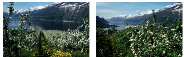
Figur 3 a og b. Illustrasjonar til spørsmål om fjordlandskapet på Vestlandet er prega av mange frukthagar. Er desse med på å gje deg ei meir verdifull oppleving av Vestlandet og landskapet her?