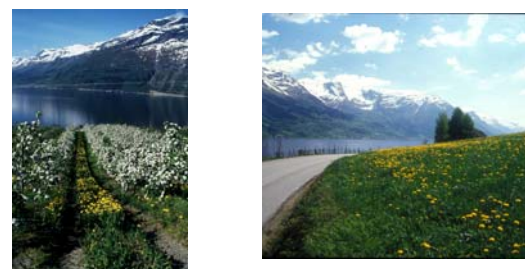
Figur 4a og b. Illustrasjon til spørsmålet om ope landskap er å føretrekkja framføre frukthagar?