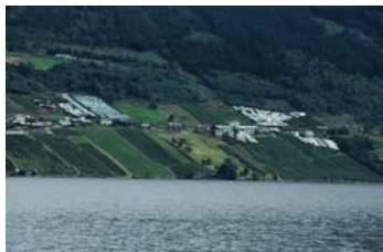
Figur 6 a og b. Illustrasjon til spørsmålet om at mange frukthagar (moreller) er dekkja med plast; Bidreg denne typen fruktproduksjon negativt eller positivt til di oppleving av landskapet?

I alt 760 skjema kom i retur i utfylt stand. Svare er sorterte etter heimlandet til respondentane, og berre dei europeiske landa med flest svar (Noreg, UK, Nederland,