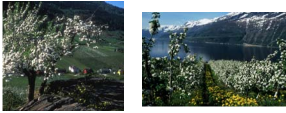
Fig. 5 a og b. Illustrasjonar til spørsmålet om små frukttrær i tette frukthagar er å føretrekke framføre fruktproduksjon på store trær?