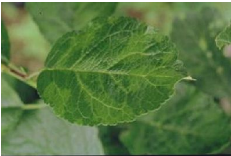
På bladene av plomme 'Mallard' ser en gulgrønne felter forårsaket av sharkavirus