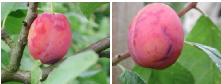
Plomme 'Victoria' med blå, innsunkne flekker og mørkfargede ringer