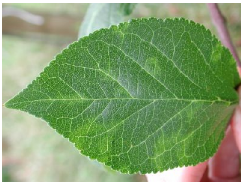
Plomme 'Victoria' viser ingen eller svært svake bladsymptomer. Symptomene på dette bladet er synlige med gjennomfallende lys.