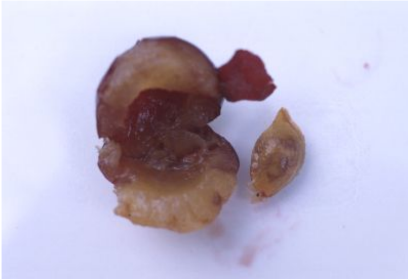
Frukt fra infiserte plommetre 'Rivers Early Prolific' med ringer på steinen og brune flekker i fruktkjøttet som skyldes sharkavirusinfeksjon