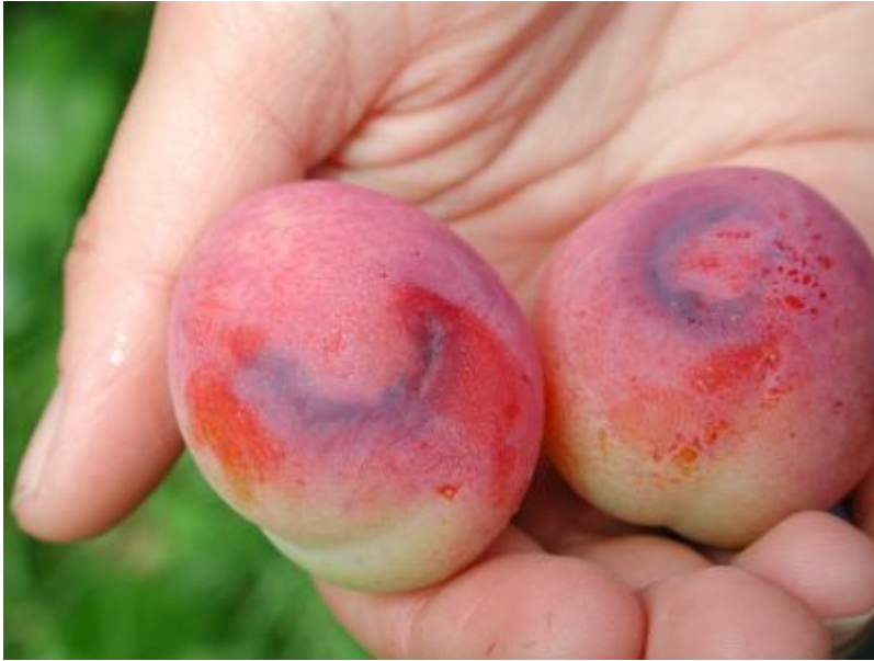
Plomme 'Victoria' med blå, innsunkne ringflekker som skyldes sharkavirus. Fruktene på infiserte 'Victoria'-trær kan skades sterkt