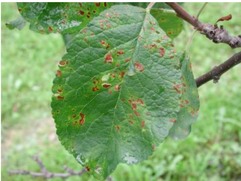
Blader av plomme 'Mallard' med nekrotiske og gule flekker forårsaket av sharkavirus