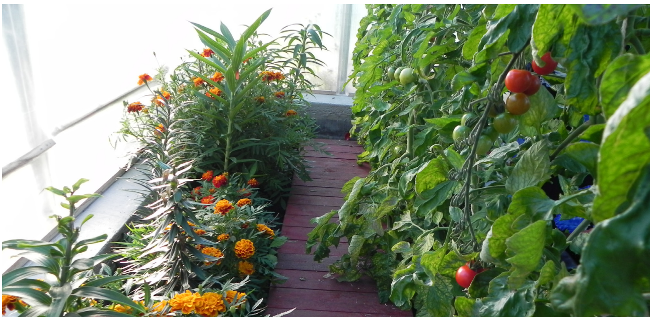
Figur 4. Tomater og tagetes i veksthus.

' Brandywine ' et sortsklenodie fra amishkulturen i Pennsylvania. Sorten er kjent tilbake fra 1885. Tomatene er modne når de er rosa røde og må høstes innen det tynne skallet sprekker. Kjøtte er saftig, tett og smaken som vannmelon. ' Brandywine ' har ry for at være verdens beste. Den setter ofte to topper, som må bindes opp hver for seg.