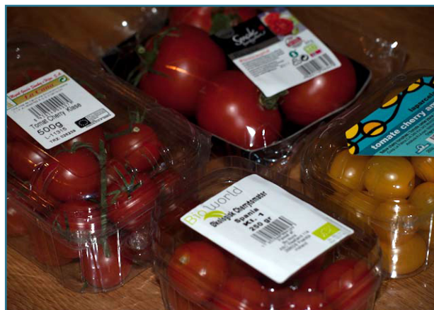
Figur 1. Noen forbrukere forbinder pakkede tomater med en høyere kvalitet.

Betydningen av kvalitetskravene varierer med, om det er sett med forbrukerens øyne eller produsentens og hvorledes produsenten avsetter tomatene sine. Betraktet med en yrkesgartners øyne vil kravet om høy andel av 1. kvalitet og jevn ensartet sortsmateriale veie tungt. Høytstående ensartet sortsmateriale oppnås med hybrider som F1-sorter. For en hobbydyrker kan det derimot være praktisk og spennende med gamle sorter, hvor modningen strekker sig over lengre tid. Hvis det er tillatt selv å avle videre på tomatfrøene, kan det gjøres med disse sortene. F1-sortene er ikke egnede. Kvalitetskravet om god lagringsevne varierer med behovet for transport etter høsting. Behovet for tomatdyrking med lav arbeidsinnsats vil også vekke ulike etter hvor mye tid og mannskap, det er til rådighet.