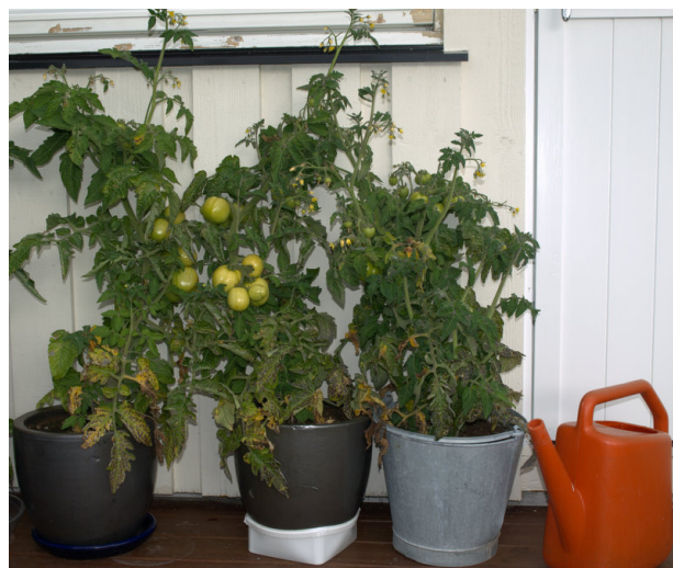
Figur 3. Tomater ute.

' Rote murmel ' er en annen nyhet innen villtomater. Veksten er mindre frodig enn ' Golden currant ' og fruktens farge er rød. Beste resultat blir når spiretemperaturen holdes på 24 °C.