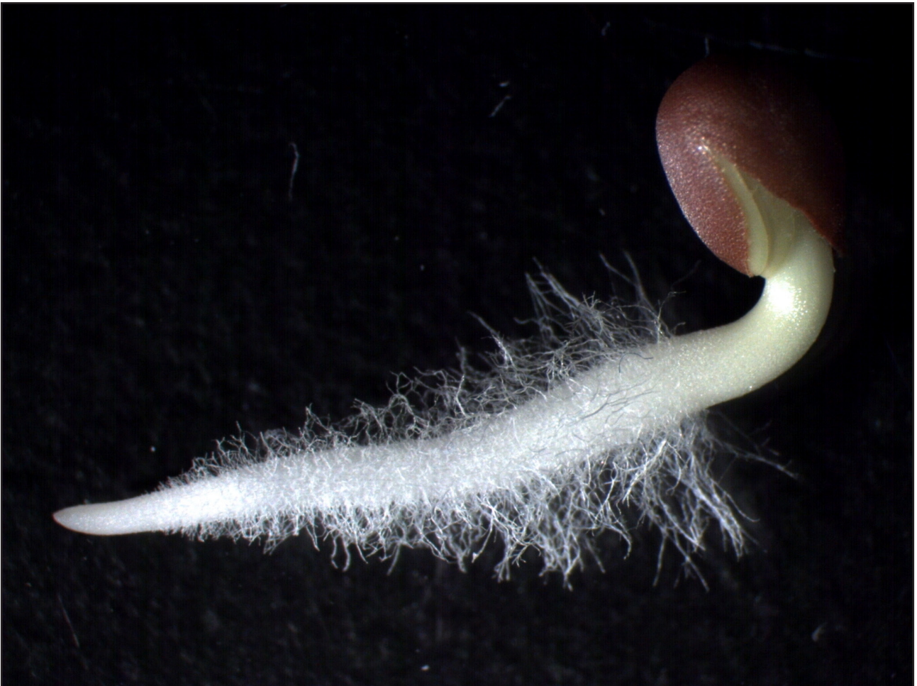
Figur 2. Roten til en reddikspire, tre dager gammel med mange tynne «rothår».